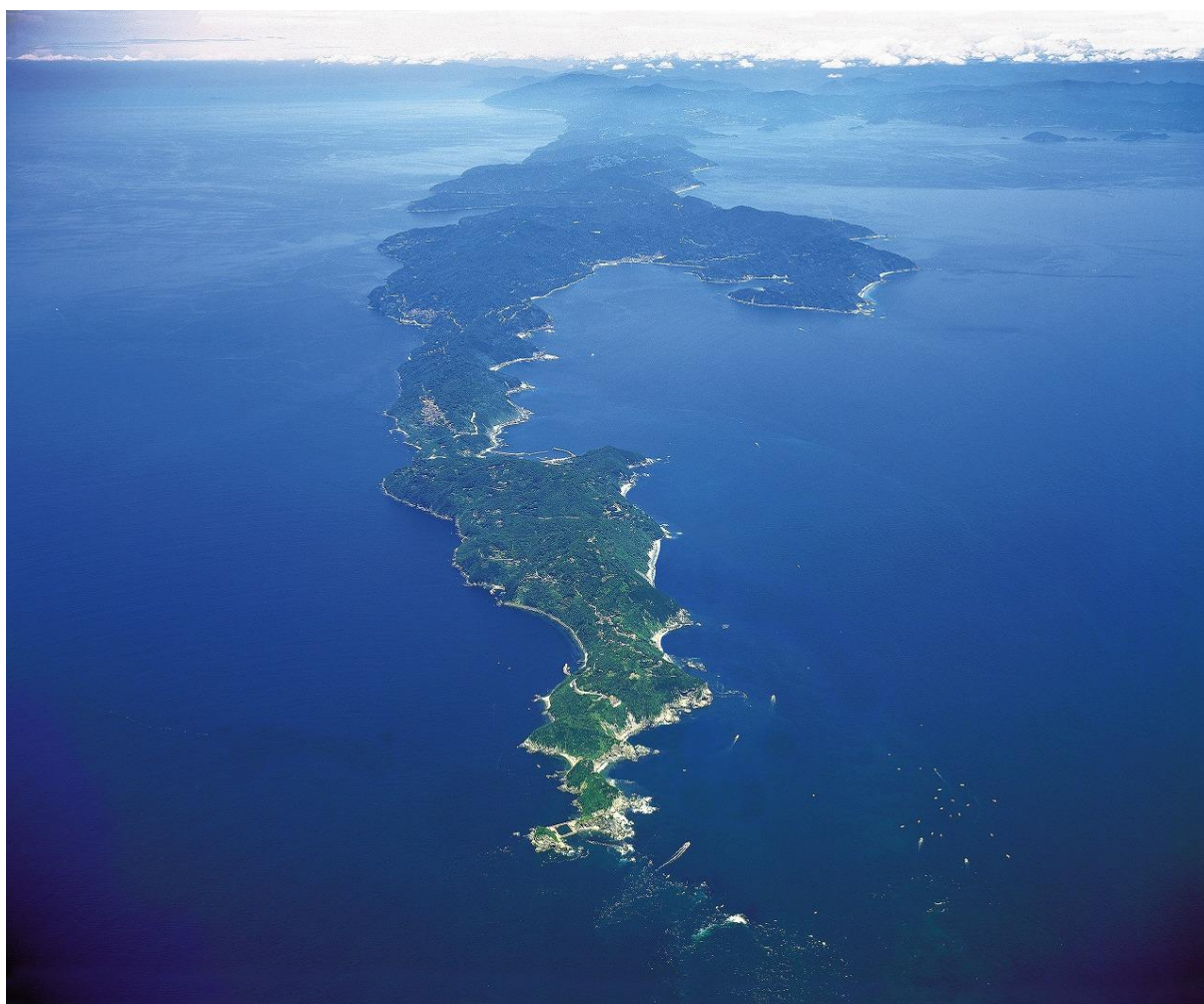
〔佐田岬半島航空写真図〕