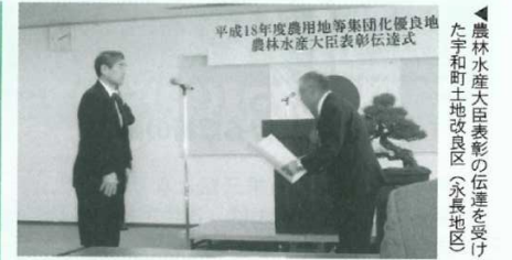
▲農林水産大臣表彰の伝達を受ける宇和町土地改良区（永長地区）

宇和町土地改良区が農林水産大臣表彰受賞 西予市宇和町土地改良区（永長地区）が、平成18年度「農用地等集約化優良地区」農林水産大臣表彰を受賞。同地区が取り組んだ経営体育成基盤整備事業では、ほ場を大区画化することで大型機械の導入等作業労力の軽減や、水管理労力の軽減を実現し、農用地の集約化と、担い手農家への利用集積を推進しました。