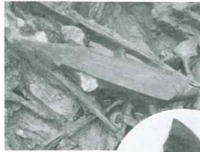
▲比較的低湿地であったため、木製農具がほぼ良好な状態で出土した（写真／ナスビ形鍬）

■中国大陸から朝鮮半島を経由して稲作が伝わったとき、水田の区画や農具のあり方はほぼ完成されていたと考えられます。坪栗遺跡でも、鍬（または鋤）で田を耕し、稲を植え、（出土はしてませんが）石包丁で穂を摘み、倉庫などに蓄えていたという、農耕生活の流れが想像できます。