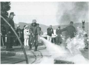
久枝3区の住民による消火訓練（3月21日）