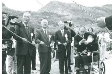
※「塔和子全詩集」は市民図書館中央館（2、3巻）、明浜分館（1～3巻）にあります。ほか、詩文集など明浜分館にて借られます。

塔さんを支援する全国の仲間と西予市民、西予市の協力により、一万人を超える方々の賛同をいただき、このたび文学碑が完成し、塔さんご出席のもと無事に除幕式を終えました。