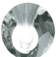
この部分が、つきたての餅のようであるので、「雪餅草(和名)」と名付けられた

本州の一部、四国の低山地の湿潤で薄暗い林床、林縁に自生する多年草である。葉は頂上近くに二枚で鳥足状、三〜五枚の小葉がある。葉柄には蛇斑紋があり、猛毒を持つマムシの肌