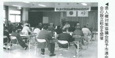
▲県人権対策協議会西予市連合会の設立総会を開催

コカ・コーラボトリング(株)営業所新築起工式 4月19日、四国コカ・コーラボトリング(株)の南予営業所（仮称）新築工事の起工式が宇和町永長地区で行われました。大洲市と宇和島市にある同社の営業所の統合・移転に伴い、地元永長地区の支援により、西予市への誘致に成功したものです。敷地面積約1万2千㎡、今年9月の営業開始予定です。