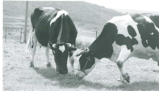
▼仲良く牧草をはむ大野ヶ原の乳牛