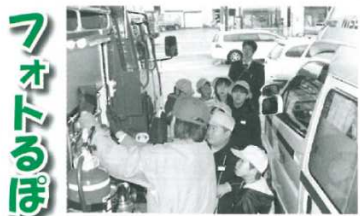
中筋小学校署内見学（3月15日）