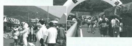
▶ダム堰堤を通過するハーフマラソンの走者

好天に恵まれた4月29日、第31回宇和れんげまつり（JR伊予石城駅前田圃）は過去最高の4万5千人の人数でにぎわいました。姉妹都市の黒松内町（北海道）からの交流訪問団5人も、まちまきや日本一のもちつき大会に参加し、西予市民と一緒に初夏を思わせるような一日を満喫しました。