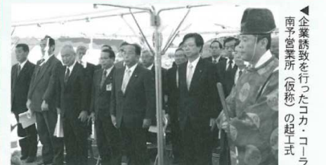
▲企業誘致を行ったコカ・コーラ南予営業所（仮称）の起工式

宇和町土地改良区が農林水産大臣表彰受賞 西予市宇和町土地改良区（永長地区）が、平成18年度「農用地等集約化優良地区」農林水産大臣表彰を受賞。同地区が取り組んだ経営体育成基盤整備事業では、ほ場を大区画化することで大型機械の導入等作業労力の軽減や、水管理労力の軽減を実現し、農用地の集約化と、担い手農家への利用集積を推進しました。