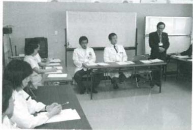
▶毎月開催される「病院運営委員会」（委員長／當我病院長）