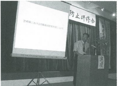
▲口蹄疫に関する研修会