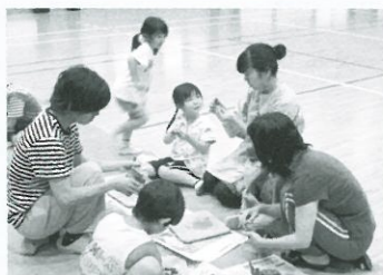
▲小学校にて陶芸教室

集落回りをしている中で最近特に気に掛かることがあります。それは「医療」の問題です。惣川は集落のほぼ中心に診療所が1軒あります。常駐の医師はおらず、週2回(月曜・水曜)野村から医師