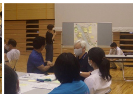
▲ 各グループの意見の確認