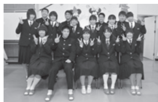
三瓶高校家庭クラブ

昭和20年から61年まで教職に就かれ、三崎町二名津 小学校長、大和田小学校長、田之筋小学校長を歴任。 在職中は、確かな教育観と信念に貫かれた強い使命感 を持って精励するとともに、PTAや地域の人々と 深くかかわりを持ち、家庭教育・社会教育の振興にも 顕著な功績を挙げられました。