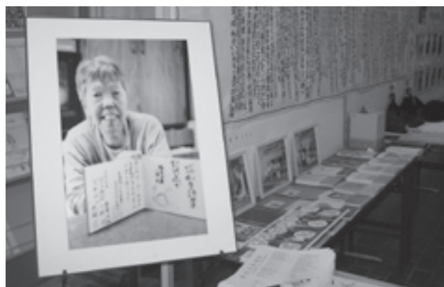
秘蔵写真や愛用品が並ぶ