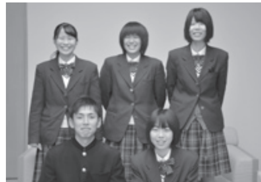
野村高校畜産科栽培班

楽しい競技なので、これから西予市内にクラブチームができたらいいな、なんて願っています」