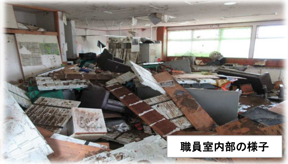
職員室内部の様子