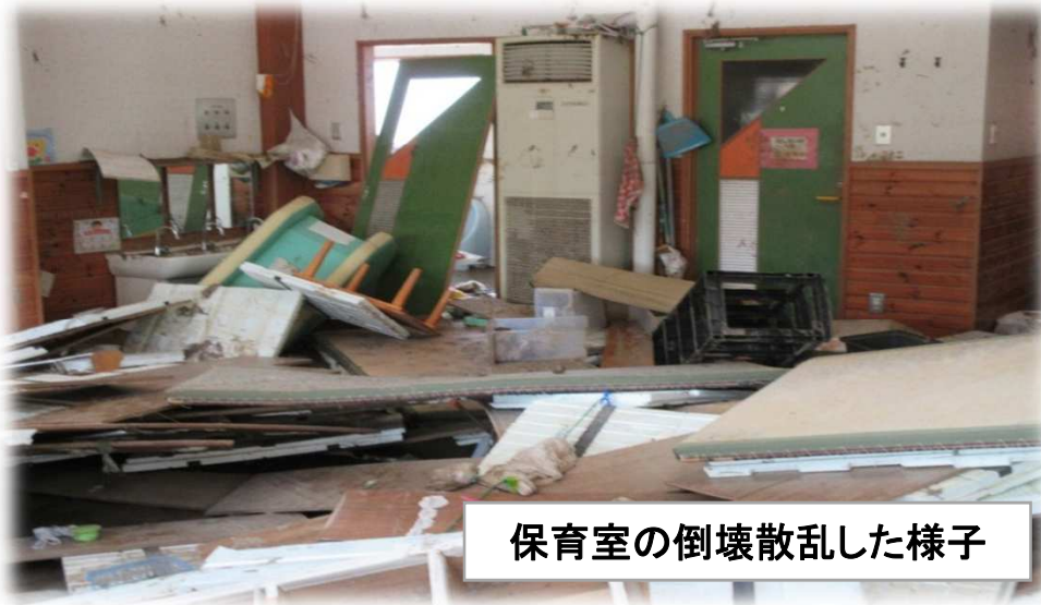
保育室の倒壊散乱した様子