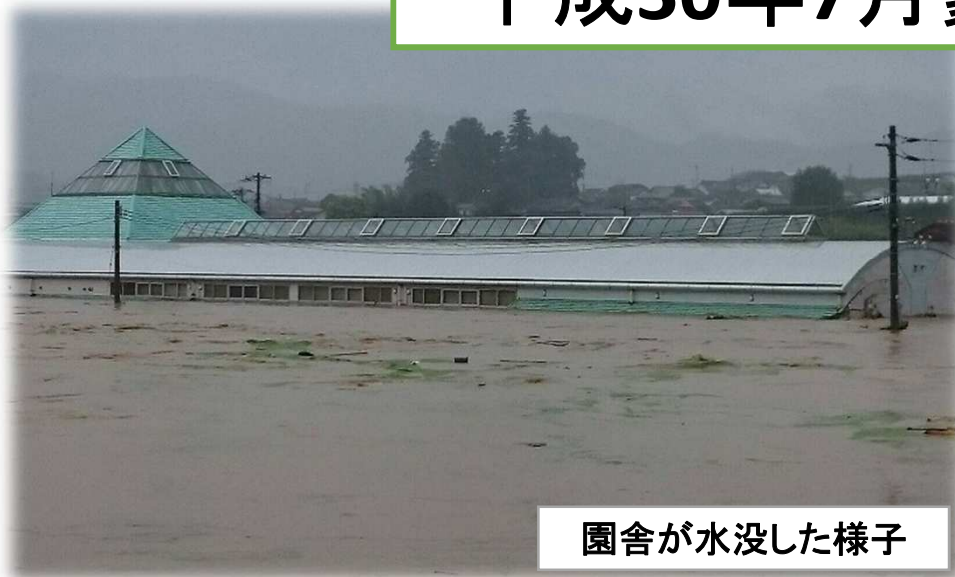
園舎が水没した様子