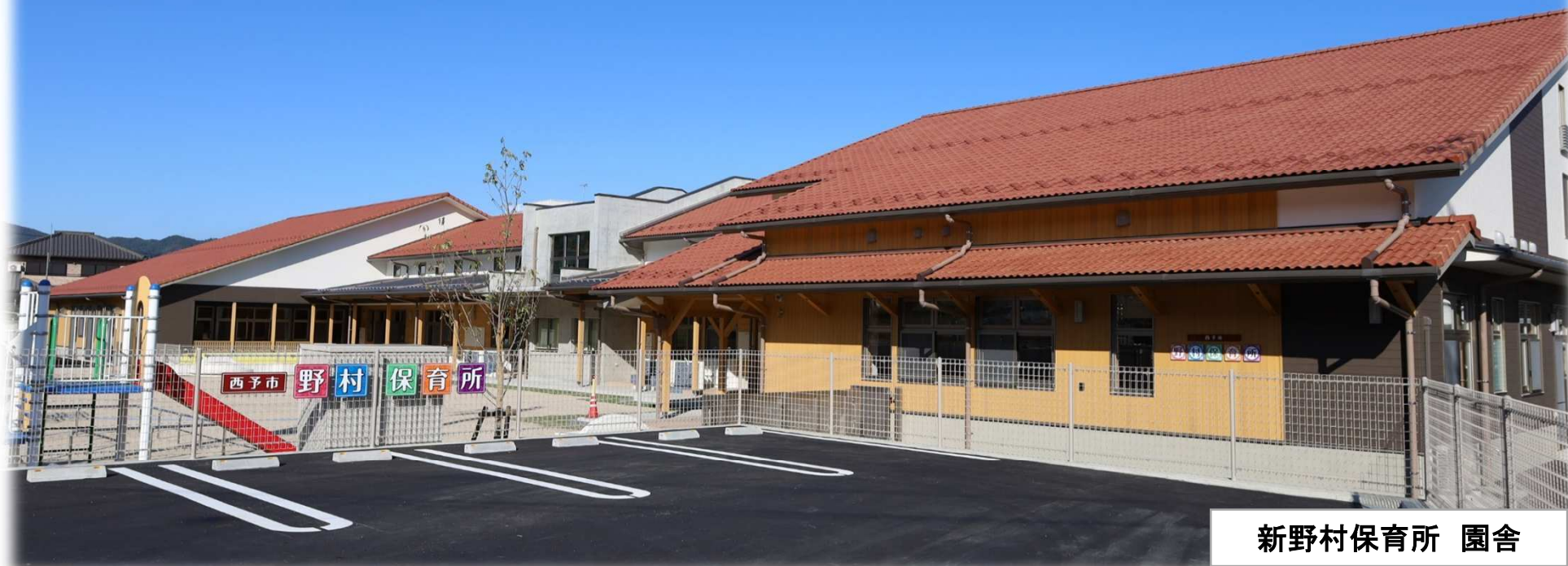
新野村保育所 園舎