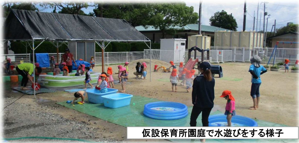
仮設保育所園庭で水遊びをする様子