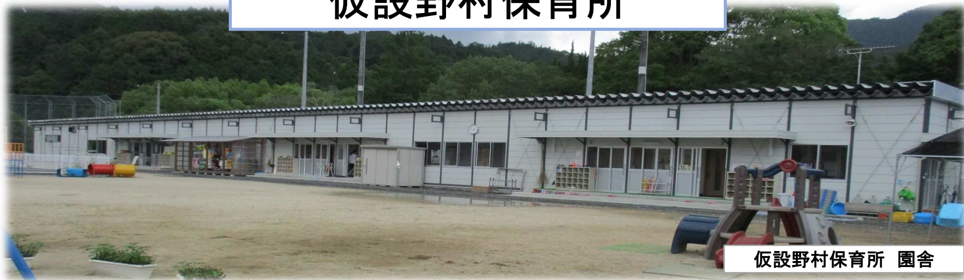
仮設野村保育所 園舎