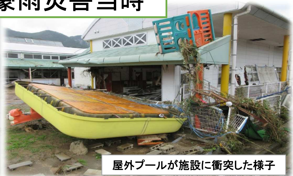
屋外プールが施設に衝突した様子