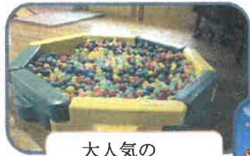
大人気の ボールプール