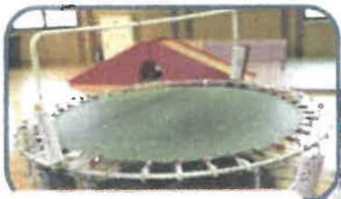
トランポリンや滑り台 もあるよ!!