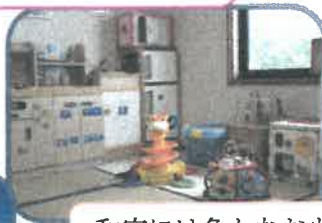
和室には色んなおもちゃ があるよ!!