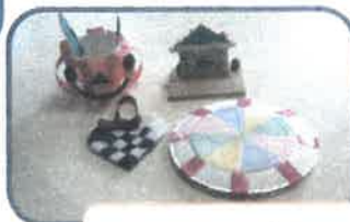
創作活動 こんなの作ったよ!