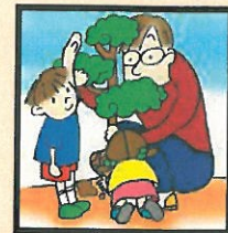
自然とのふれあい