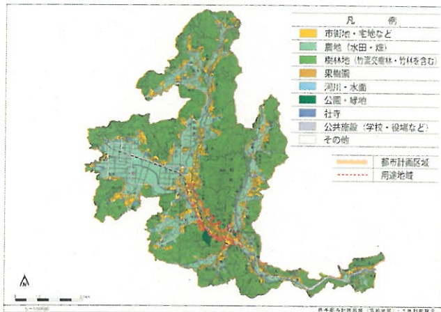
西予都市計画区域（宇和地区）