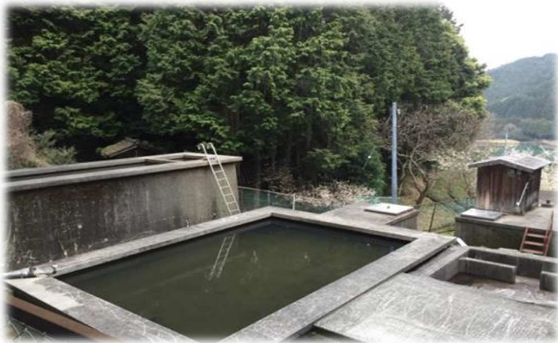
西予市宇和地区 西山田簡易水道