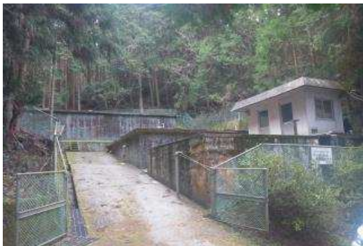
男河内成穂浄水場