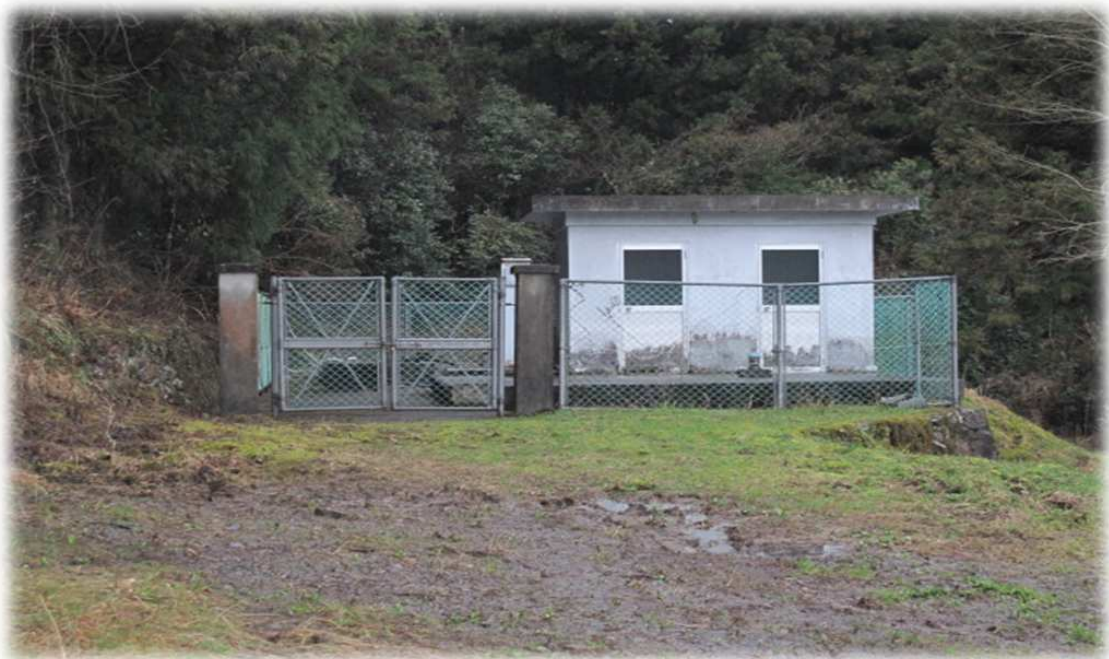
野村学園専用水道