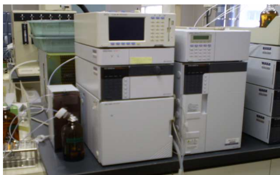
機器名 イオンクロマトグラフ 測定物質 硝酸態窒素及び亜硝酸態窒素 フッ素及びその化合物 塩化物イオン