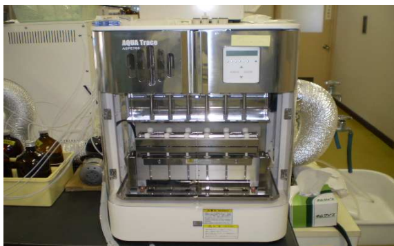
機器名 全自動固相抽出装置 測定物質 陰イオン界面活性剤 非イオン界面活性剤 フェノール類