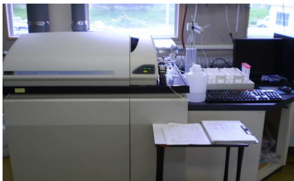
機器名 誘導結合プラズマ質量分析計 測定物質 カドミウム 鉄 マンガン