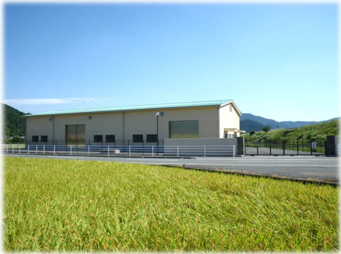
宇和給水区域 明石浄水場