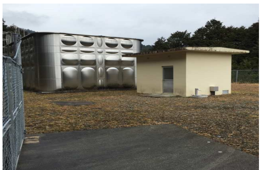
文治が駄場浄水場