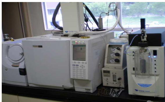
機器名 ページ&トラップ-GC-MS 測定物質 トリハロメタン 揮発性有機化合物