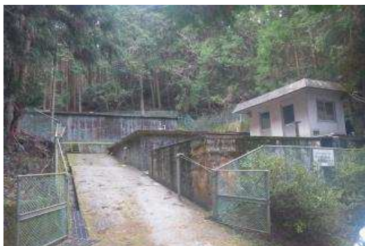
男河内成穂浄水場