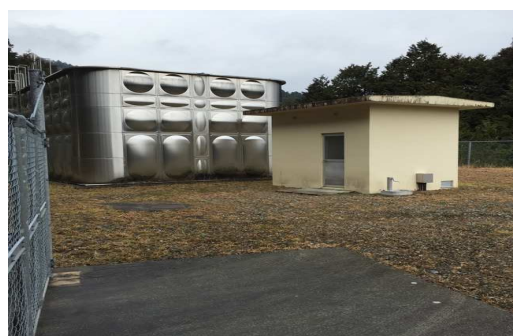
文治が駄場浄水場