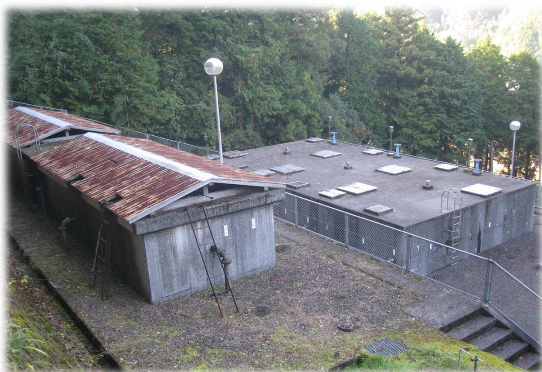
西予市城川地区 下相上簡易水道