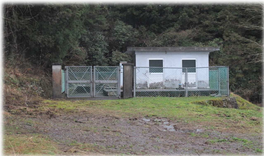
野村学園専用水道