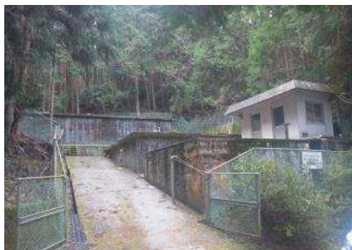
男河内成穂浄水場