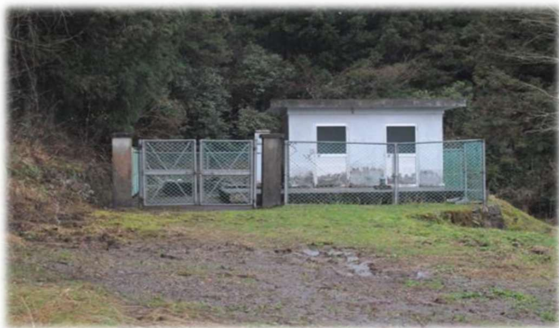
野村学園専用水道