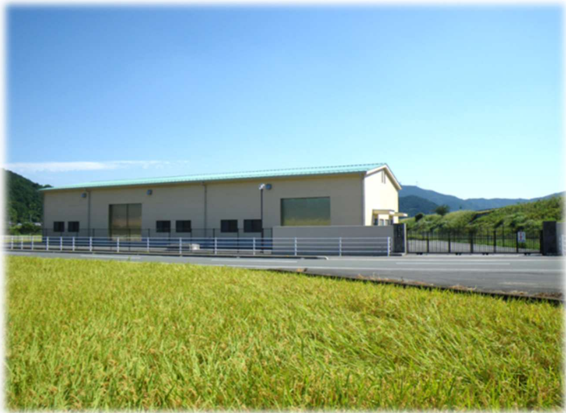
宇和給水区域 明石浄水場