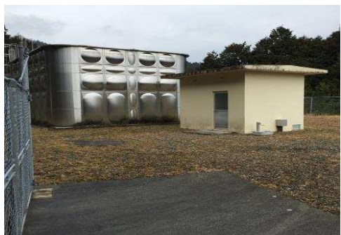
文治が駄場浄水場