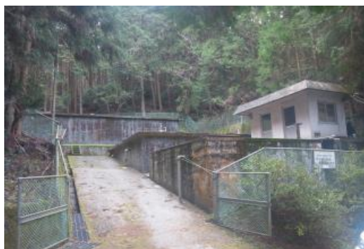
男河内成穂浄水場