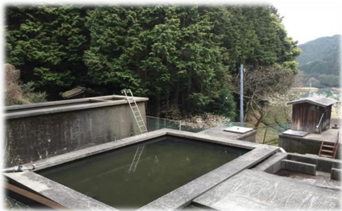
西予市宇和地区 西山田簡易水道