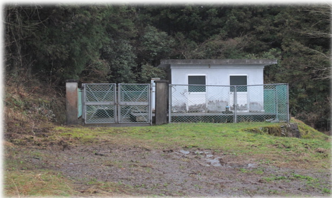
野村学園専用水道