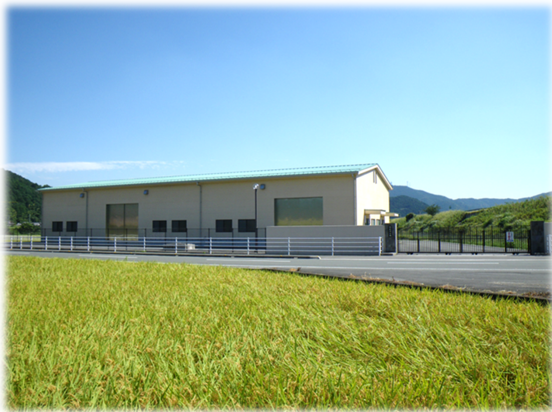
宇和給水区域 明石浄水場