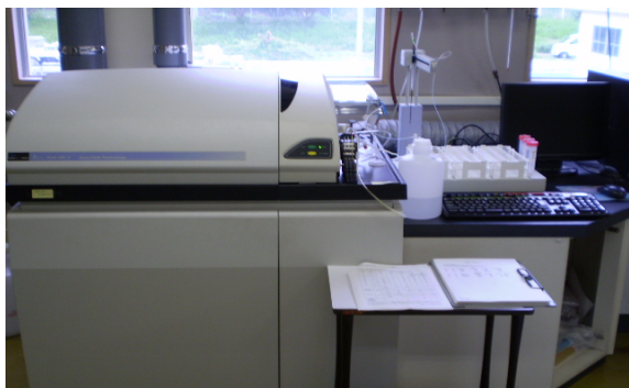
機器名 誘導結合プラズマ質量分析計 測定物質 カドミウム 鉄 マンガン