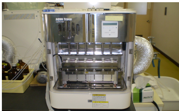
機器名 全自動固相抽出装置 測定物質 陰イオン界面活性剤 非イオン界面活性剤 フェノール類