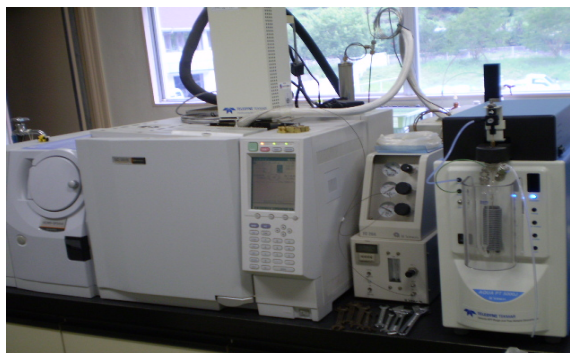
機器名 パージ&トラップ-GC-MS 測定物質 トリハロメタン 揮発性有機化合物