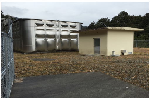
文治が駄場浄水場