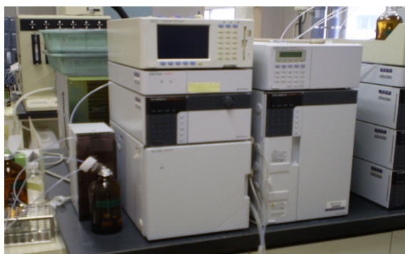
機器名 イオンクロマトグラフ 測定物質 硝酸態窒素及び亜硝酸態窒素 フッ素及びその化合物 塩化物イオン