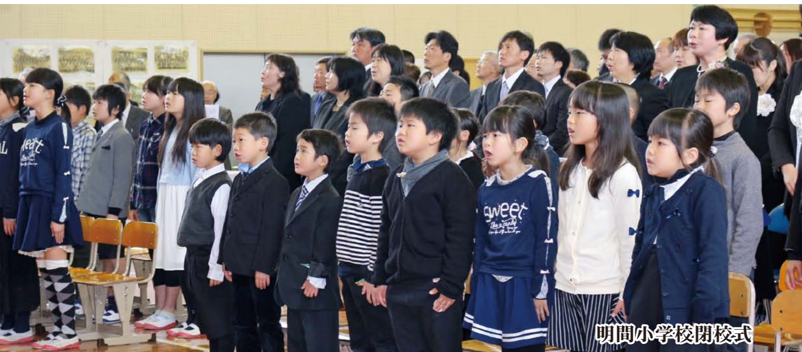
明間小学校閉校式