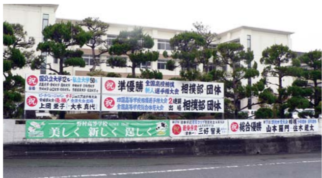
県内外で活躍する野村高校

41人まで減少。少子化が一番の理由だが、市外への進学が増えていることも理由として上げられる。 このような中、野村や三瓶地区においては、高校の存続に危機感を持たれ、地域づくり交付金などを活用し、地域でのさまざまな取り組みを行ってもらっている。他の地域においてもこのような取り組みが広がり、地域愛が醸成していくよう尽力願いたい。 県立学校は、県の管轄であるが、小学校・中学校から高校まで関連性を持った取り組みを地域の皆様や学校関係者と一緒を検討していかねばならないと考える。