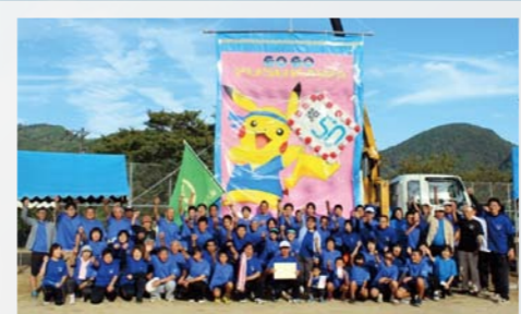
城川オリンピックでの雄姿