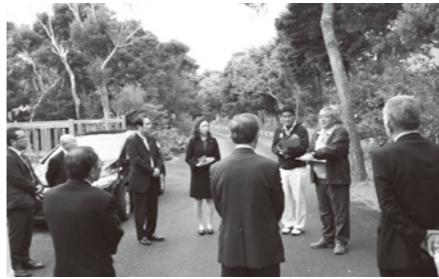
森林セラピーロードにて

石垣市では、自治基本条例及び議会情報公開について視察しました。市民協働と市民参加による行政運営は今後不可欠です。平成19年に自治基本条例策定宣言を行い、自治の基本的かつ主要な条項を条例で定め、平成24年から施行されています。国頭村では、森林セラピーのまちづくりについ