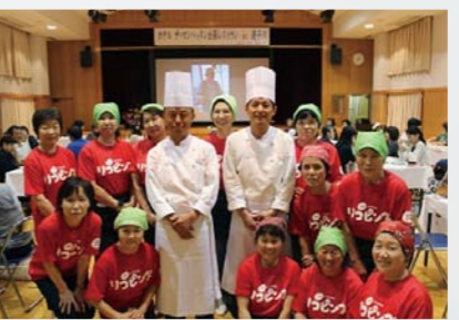
リコピンスのトマトを使った加工品開発