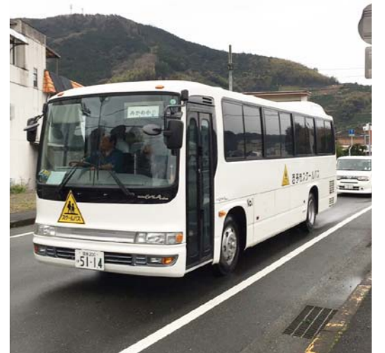
スクールバスの有効活用

長教育 バス停は現在4町で90カ所あり、そのうち待合所は26カ所で、いずれも雨風はしのげる構造となっている。既存の路線バスの待合所を利用してはいるものが21カ所、スクールバスの運