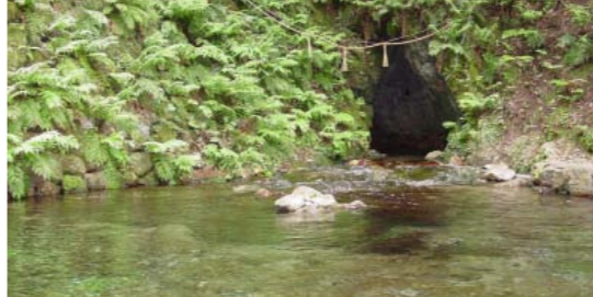
名水百選の観音水(宇和町)

し、水環境の保護の推進と水質保全意識の高揚を図ることを目的とした全国的なシンポジウムである。