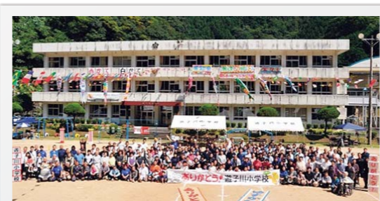
遊子川小学校閉校記念運動会(平成27年9月)

祝 おめでとうございます 遊子川地域でダブル受賞 過疎化・少子高齢化が進む城川町遊子川地域で、平成22年に地域の全住民(約320人)参加による「遊子川地域活性化プロジェクトチーム」が結成されました。 特産のトマトを使つての加工品の開発・販売、住民の3人に1人が関わる自主企画映画制作等の長年に渡る地域の取り組みが評価され、この度、総務省の「ふるさとづくり大賞」と文部科学省の「第69回優良公民館表彰最優秀館」の二冠の榮譽に輝きました。 公民館長・同主事からは口を揃えて「地域住民全員で頂いた賞です。今後とも精進していきます。」と力強いお言葉を頂きました。本当におめでとうございました。