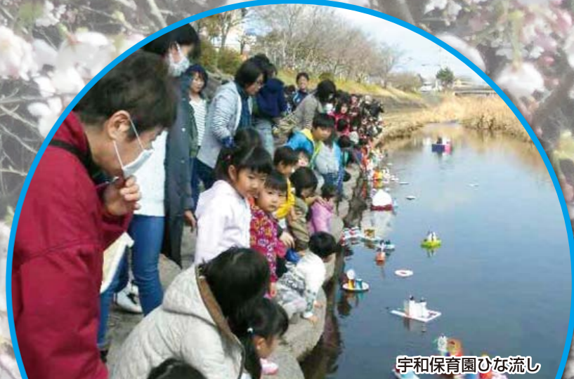
宇和保育園ひな流し