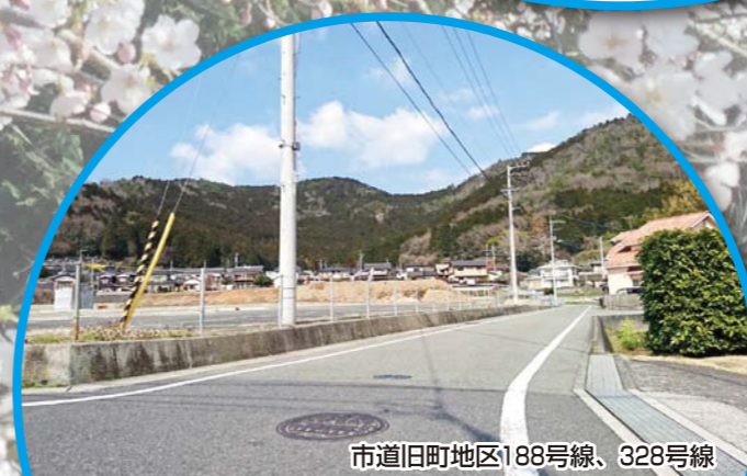
市道旧町地区188号線、328号線