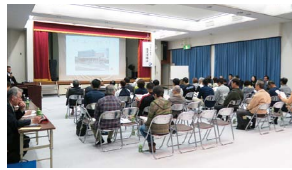
前回の意見交換会(明浜町狩江公民館)

事前質問も受け付けていますので、議会事務局までお問い合わせ下さい。 電話 0894(62)6413