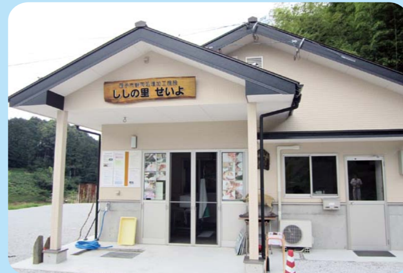
ししの里せいよ(野村町)

平成29年4月より獣肉加工処理施設「ししの里せいよ」は、ほわいとファームを運営する野村地域振興センターが管理運営することになりました。