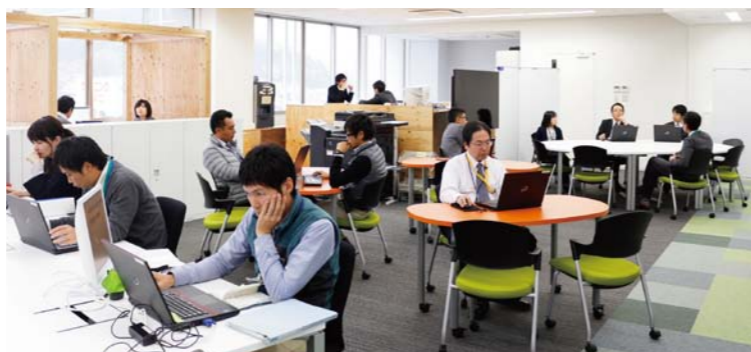
オフィス改革された市役所4階

財務 部長 現在本庁舎4階ではモデルオフィスという試行的な取り組みを行っており、新しい働き方を実践している。今後は本庁、支所、公民館を含め、電子決裁やウェブ会議などを取り入れ、情報伝達のスピード化を目指し、それが経費削減、市民サービスの向上につながるかと考えている。