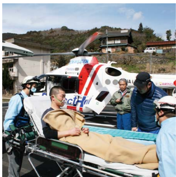
ドクターヘリ運航開始

消防 部長 愛媛県が救急医療用として導入したドクターヘリは医療機器を装備しており、ドクターが搭乗し、救急現場へ駆けつける。