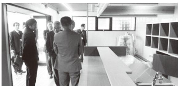
カフェ起業者の研修室

今後は、生まれ変わった米博物館がより魅力的な施設となるよう新しい管理体制で運営されます。具体的には、米の資料の展示や長い廊下を活かしたぞうきんがけ体験やZー1グランプリは継続しながら、新たな商品や仕事が生まれる環境を整える貸事務所、利用者が共有できる貸会議室などとしても利用されま