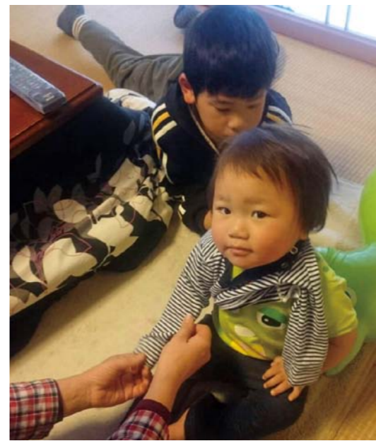
子育て支援の充実を

問 宇和町を除く4町で運営されている小学校スクールバスの停留所の設置数と、その待合所における雨風への対策は。