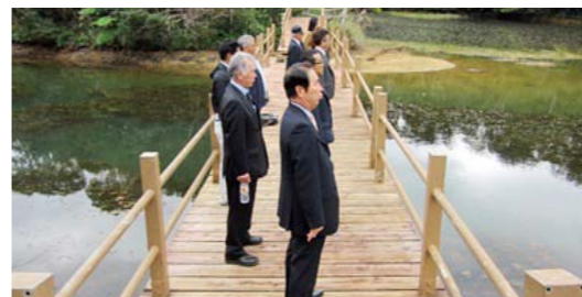
くにかみそん 国頭村森林セラピーで深呼吸(沖縄県)

財務 部長 「森林セラピー基地」認定には医学的な根拠を科学的に示す必要がある、その調査費に300万円程必要となるほか、遊歩道の幅員