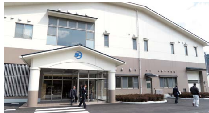
施設の愛称を落成式で公表

衛生センターの建設に携わられた多くの方々に感謝するとともに、今後本施設が有効活用され、市内の自然環境や、市民の生活環境の保全に寄与する施設として役立つことが楽しみです。