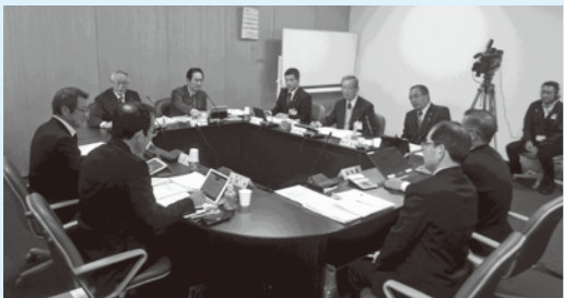
ICTを活用した審査(総務常任委員会)

ICTを最大限に活用し、働き方を変え、行政改革を行い、行政事務効率化と市民サービスの向上を図る。