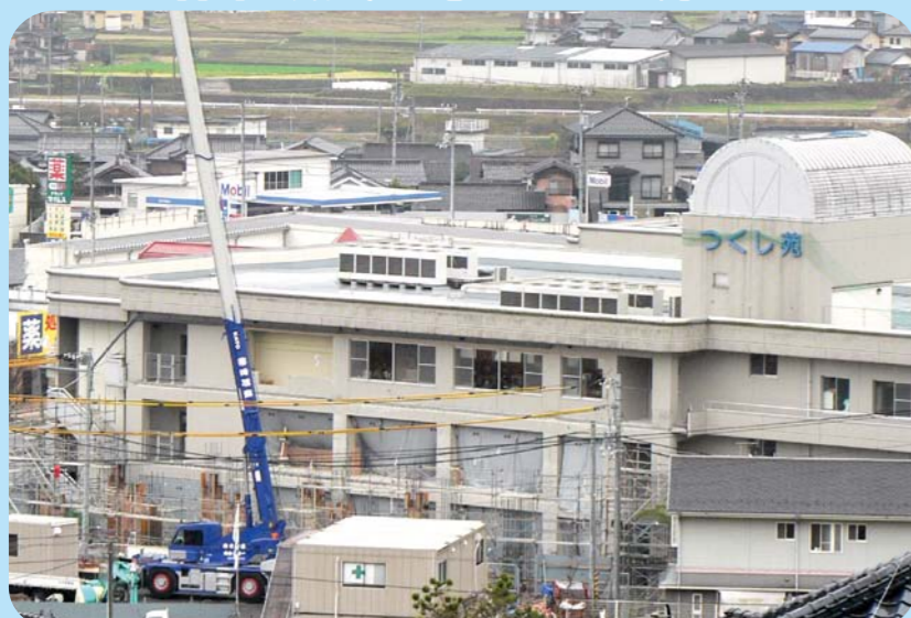
老人保健施設 つくし苑(野村町)