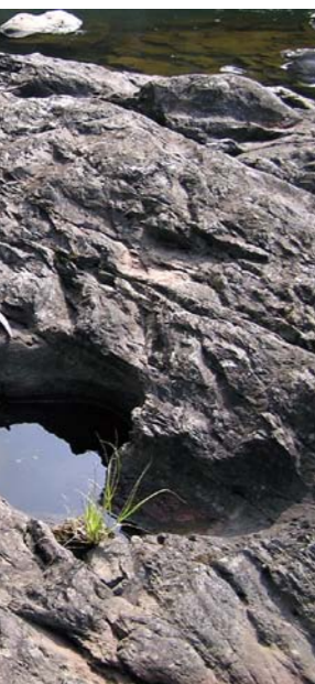
ジオポイントのひとつ 大和田橋付近のかめ穴(野村町)

市長 改革・挑戦を掲げ、安心が体感できるまちづくりを実現する政策実行予算として編成した。 人口減少対策、国体の成功、防災・減災対策、四国西予ジオパークの推進、産業、雇用創出、小規模多機能自治の推進、チャレンジ改革の7つの視点から重点施策を展開し、まち・ひと・しごとづくりの地方創生に取り組む。