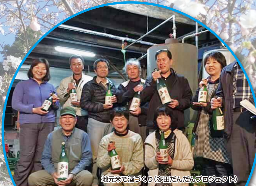
地元米で酒づくり(多田だんだんプロジェクト)

現在までのごみ収集、運搬委託 料に、本年度より介護認定者等 の世帯に個別収集を行う