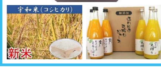
ふるさと納税返礼品

問 ふるさと納税制度で近年全国的に返礼品が過熱きみだと思つて西予市の状況はどうか。