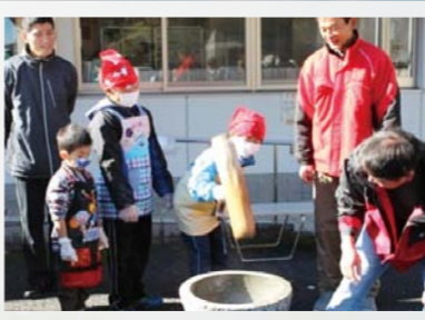
三世代交流会での餅つき