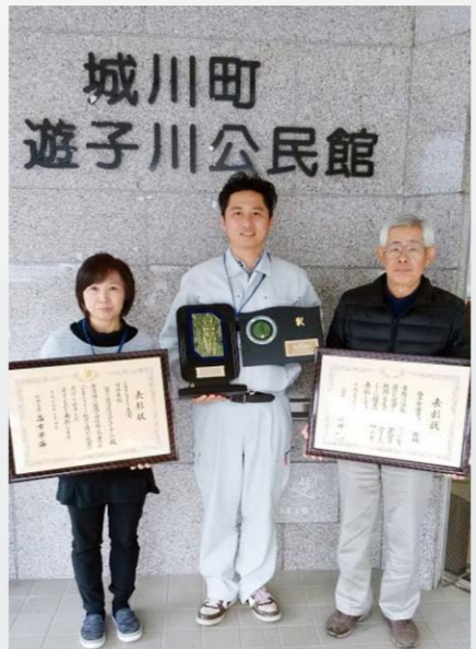
表彰状・盾を手に