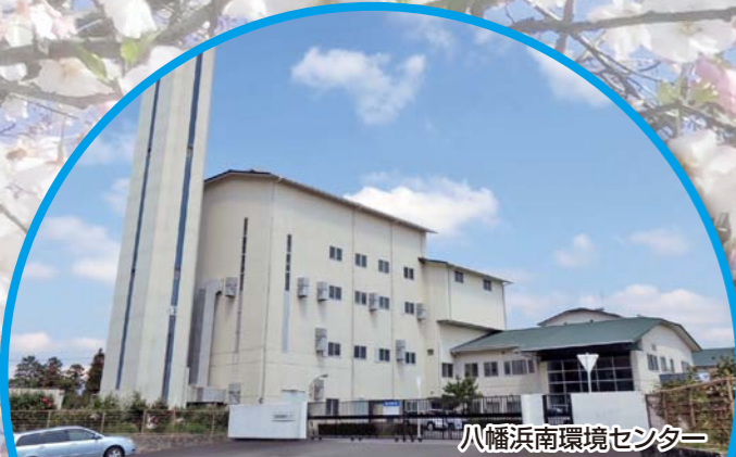
八幡浜南環境センター