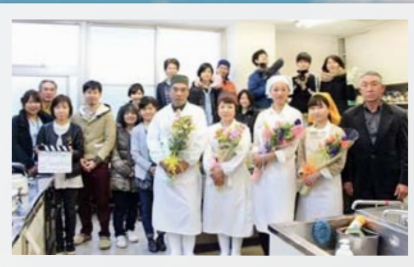
映画『食堂ゆすかわ』クラックアップ(平成26年3月)