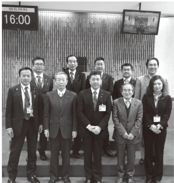
福岡県大刀洗町議会議場にて

議会改革の一環として、住民に開かれた議会実現を目指す取り組みが全国で活発化しています。議会広報紙には議会活動の広報機能と、住民の声を汲み取る広聴機能双方の充実が求められて