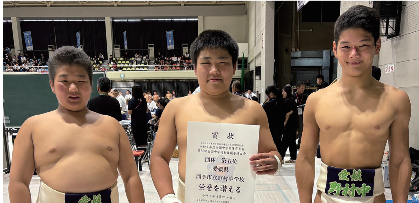
①印象に残っていること ②心残りなこと ③成長したこと ④将来の夢・希望 ⑤西予市へ一言