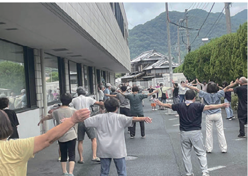
三瓶文化会館で実施中

みかめやつてみん会で取り組まれているラジオ体操、男デイ健康運動教室について調査を行い、意見交換を行なった。 西予市の高齢化率は、令和7年8月末日現在で44・7%である。大変多くの方が参加されており、健康寿命の増進や地域活性化につながっている。 西予市全体で取り組めないか、今後も調査研究を進めていく。