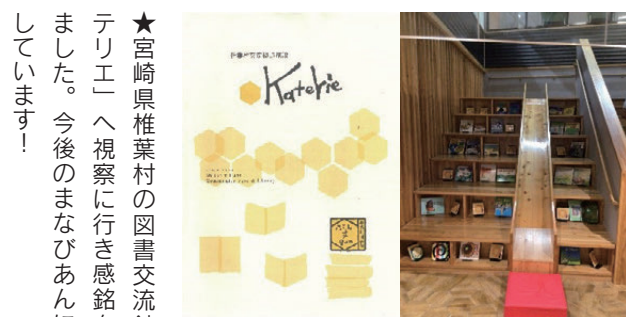
本棚にもすべり台にもなる階段 (カテリーエ)

★宮崎県椎葉村の図書交流館「カテリーエ」へ視察に行き感銘を受けました。今後のまなびあんに期待しています！