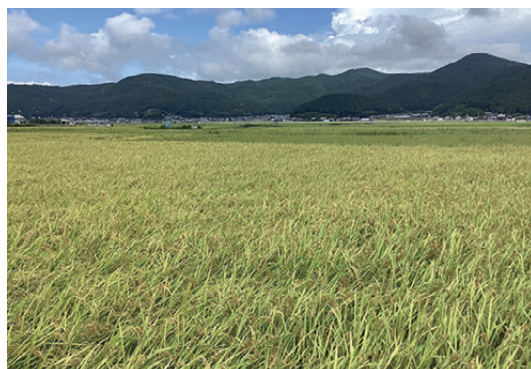
収穫期を迎えた宇和盆地の田んぼ

A 自治会への直接的な介入は必ずしも好ましいことではないが、継続的な自治会運営ができるよう、長期的な視点に立ち、地域の実情に応じたサポートを行うていく必要がある。