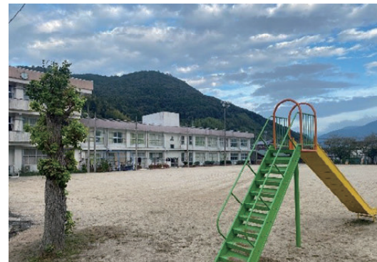
子どものための教育環境を目指して

今後の学校の統廃合の検討状況、市民の利用状況を踏まえて対象となる施設を選定し、特例交付金の対象期間内に整備が完了するよう計画的に進めたい。