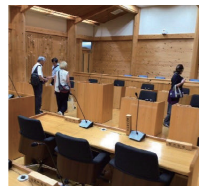
94%が森林の椎葉村議場のほとんどが木製だった

※ 1 複数の組織が特定の目的・プロジェクト達成のために協力し合う事業体 ※ 2 観光地域づくり法人のこと。多様な関係者と協働しながら魅力向上や受け入れ環境の整備など、観光地域全体のマネジメントの取り組みが期待される。