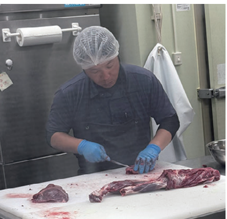
解体中のイノシシ

ギャラリーしろかわではかまぼこ板の展示会を見学するとともに、多数の美術品を保管してある収蔵庫を視察。これらは西予市民の宝であり、できるだけ多くの市民の目に触れる機会を設けてほしい。 ししの里せいよでは3頭のイノシシが持ち込まれて解体中だった。ジビエ消費を拡大し、鳥獣害被害の減少にも寄与することが望まれている。