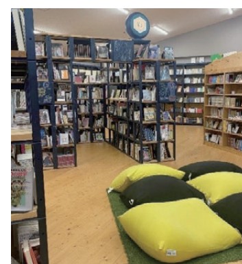
楽しいしかけがいっぱいの椎葉村交流拠点施設 Katerie

なかでも委員全員、感銘を受けたのが、コロナ禍にオープンした交流拠点施設「かてりえ」。椎葉の伝統として助け合いの精神のことを「かてり」と言うことから、村民だけでなく、遠くから来た人とも交流が生まれる施設として設計されていた。