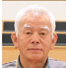
二宮 一朗 (公明党)