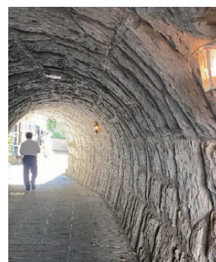
名曲が流れる廉太郎トンネル（竹田市）

城下町エリアでは、※ 1 コンソーシアム事業として、まちづくり会社を設立し、町並みと第一次産業をつなげたイベントや、町歩きを促す場所づくりに取り組まれている。