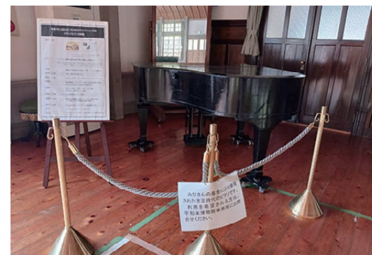
ドイツフォイリツヒ社製グランドピアノ 1923(大正12)年製造 今年102歳

①イベント等でのピアノ使用時に調律等のメンテナンスが必要な場合は、専門技術者に依頼の上で使用するように主催団体へお願いしている。②定期調律は、年間のイベント開催時における主催団体での調律で対応していく方針である。③保管方法は、直射日光を避ける場所での保管に配慮しており、移動時は専用キャスターを設置して本体への負担を軽減している。④使用方法は、「ピアノの使用に関する規程」を設けて使用時間や遵守事項を明確にしておき、規程に基づき適切に使用していただいている。