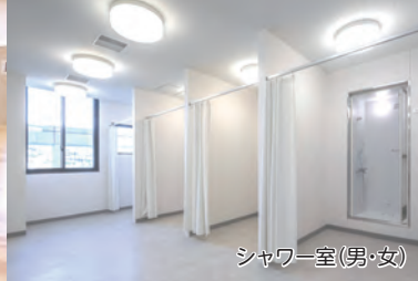
シャワー室(男・女)