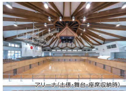
アリーナ(土俵・舞台・座席収納時)

土俵と舞台、座席を収納すると、バレーボールコート2面又はバドミントンコート4面が利用できます。