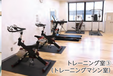
トレーニング室③ (トレーニングマシン室)