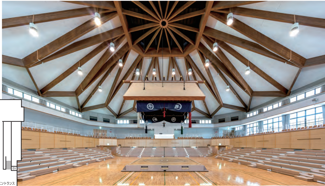
アリーナ(土俵・舞台・座席設置時)