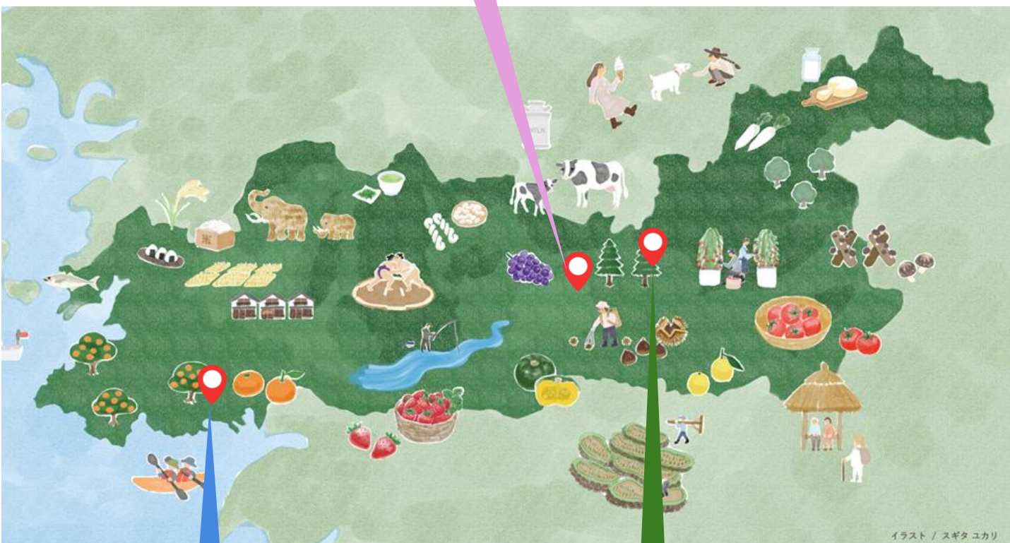
イラスト / スギタ ユカリ