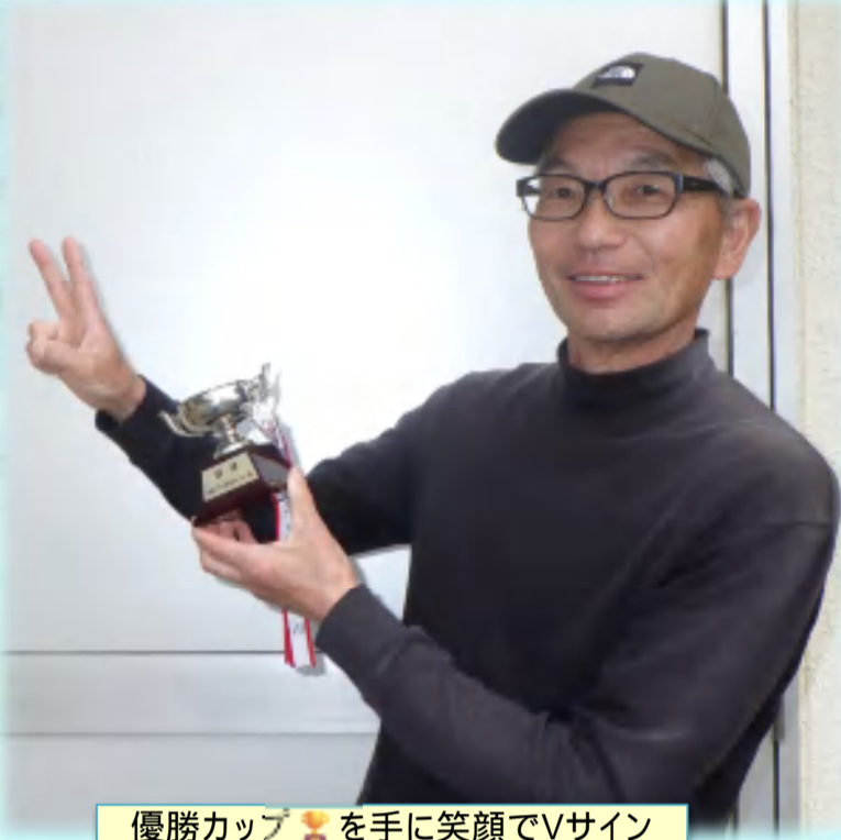
優勝カップを手に笑顔でVサイン