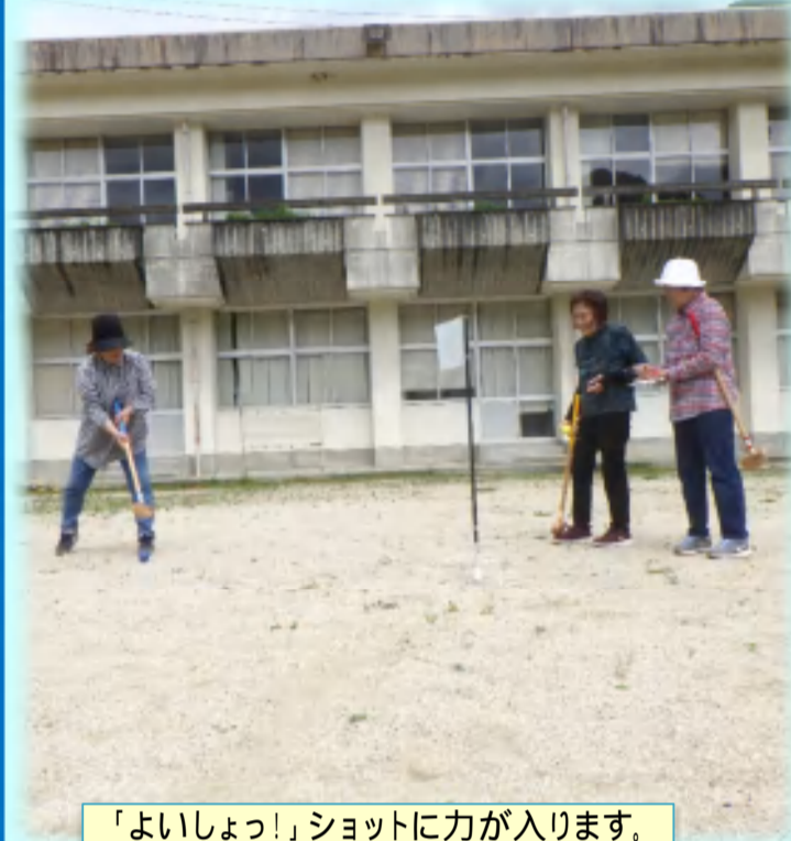
「よいしょっ!」ショットに力が入ります。