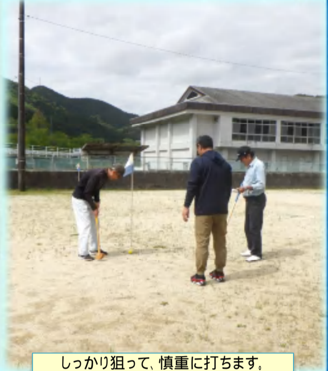
しっかり狙って、慎重に打ちます。

4/20(月)、明間地区グラウンドにおきまして「第4回明間地域づくり活動センター長杯グラウンドゴルフ大会」を開催いたしました。今回の大会には、7名の参加をいただき、「わいわい、がやがや」と交流を図りながら気持ち良い汗を流しました。グラウンドゴルフはルールもわかりやすく、子どもから大人までの幅広い世代で、また、初めての方でも楽しむことができます。機材一式貸し出しも可能ですので、遠慮なさらずに明間地域づくり活動センターまでお声掛けください。