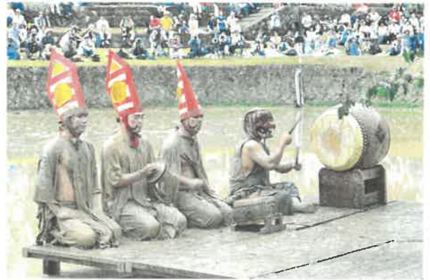
県指定無形民俗文化財 御田植え神事