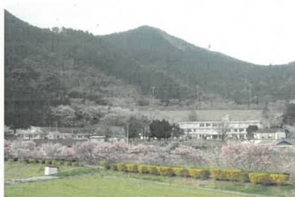
旧土居小学校周辺の桜