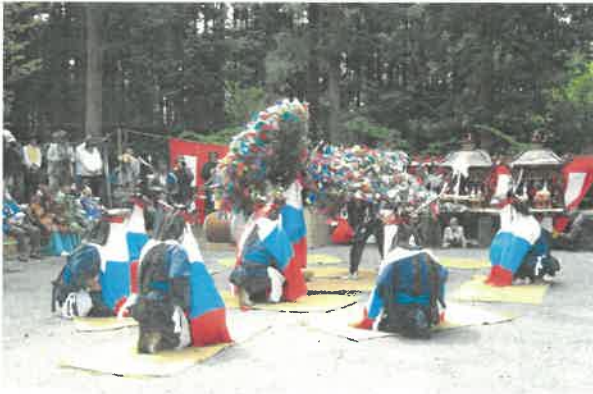
国選択無形民俗文化財 八つ鹿踊り