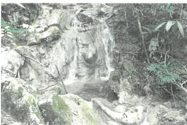
中津川のトゥファ