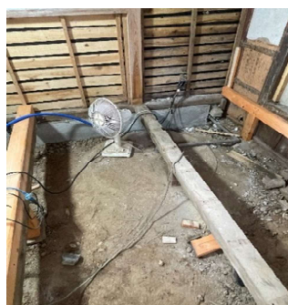
床下から古井戸らしき跡が・・・

※山際の立地ですし、登記上は大正元年の古民家ですので覚悟はしていましたが、様々な問題が出るは出るは・・・