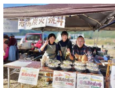
メガ盛りの古代米ご飯丼も大好評