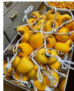
皮むき→煮沸消毒⑮秒