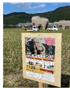
今年は立て看板設置