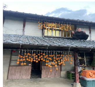
朝方の霧がちょっと心配です