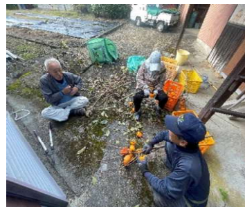
なんと長閑でまったりな空気感

※柿の木は柔らかく、登るときはドキドキでした。師匠から教わった手順通りに仕込みましたが上手く仕上がるか心配です。