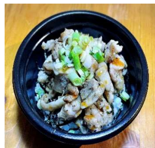
我が家の若鶏炭火焼き丼