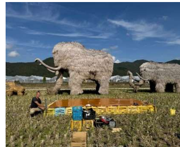
4坪半のコンテナ特設ステージ

※まつりの運営側でありながら、どんぶりグランプリにも石城の便利屋さん屋号で参加し、楽しませていただきました。