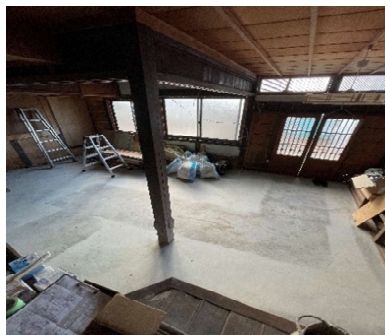
玄関土間に除去できない柱が・・・