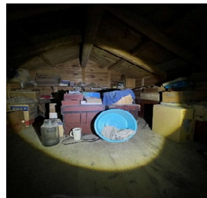
蔵2階はかなりのボリューム