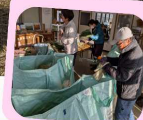
しめ飾りの金具外し作業