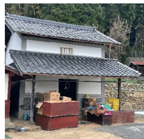
長持は惜しみつつ解体しました