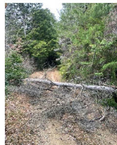
倒木をチェーンソーで解体撤去

※しめ縄飾りを終え、山から下りた後は、保存会の女性陣が作った美味しくて温かいお汁とぜんざいとお餅をいただきました。