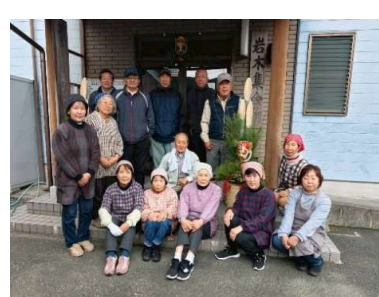
1年間お疲れさまでした！！