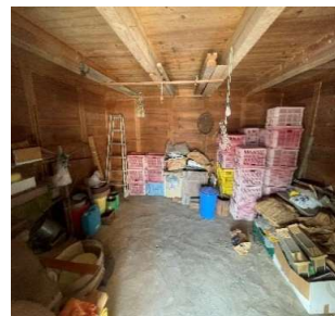
蔵1階の残置物(お宝)

※最後の片付けは土蔵の中の材木や棚やタンス類とその中の布団や食器や人形やその他いろいろ・・・