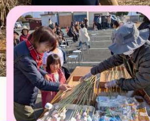
恒例のマシュマロ焼き