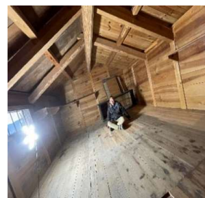
ニヤニヤと妄想中