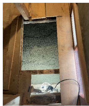
ボットンは埋め立てました