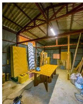
材料加工はにわか作業場にて

※小動物侵入防止の隙間塞ぎがすんだら上部から順番に虫も入らぬよう、天井→壁→床と修繕を進めています。