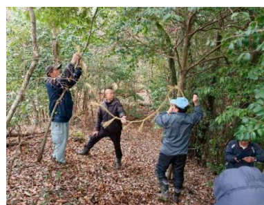
権現山頂標高530メートル