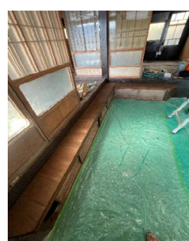
グラグラの式台を補強