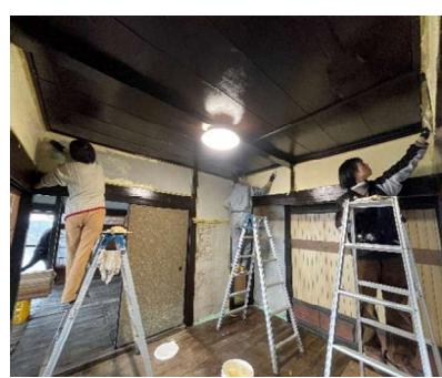
天井塗装の後、漆喰手塗り 🍡 仕上げ

新年の抱負としましては、よりいっそう計画的に行動し、時間を最大限有効に使いたいと思います。もちろん遊び心や楽しむ事も大切にしたいところですが、終の棲家の完成→引っ越し（岩木内）→地域おこし協力隊卒業後の生業づくりに集中し、馬力をかけて行く所存です。2026年も石城の便利屋さん！そして田んぼや畑や山やお料理や地域づくりへのご指導・アドバイス程、宜しくお願い致します！！