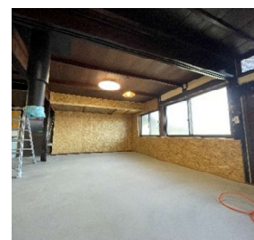
念願の土間ダイニング