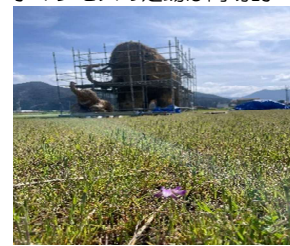
今年はレンゲが少ないですね