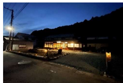
我が家に明かりが灯りました

中山ゆたか石城録をご覧頂きありがとうございます。私事ですが新年度より『石城の便利屋さん』改め、『石城のなんでも屋』と名乗らせていただきます。（何でも出来るようになりたいという思いを込めて）年度末年始はお引越しのお手伝いや家具の移動、草刈り、庭木の剪定などのご依頼を多くいただきました。一人親方ですので出来る事に限りはありますが、安くて迅速丁寧を目指して頑張りますので今後ともよろしくお願いいたします。