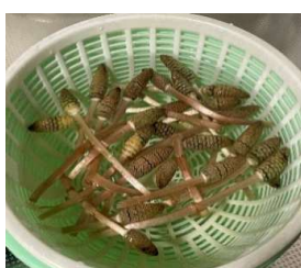
我が家の畑のつくしんぼ

※今年は早めに新芽を収穫できたので、味も香りも食感も昨年より良好でした。裏山のタケノコは次回報告させていただきます。