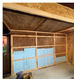
漆喰と土壁が崩れた内壁

※令和8年4月1日入居にむけて必要最低限の修繕は完了。今後半年～1年かけてガレージ・蔵・庭の畑を生き返らせます！