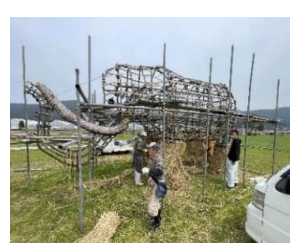
子マンモスの足場は簡易的