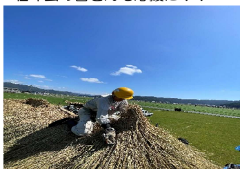
背中のだてがみを造りこむ