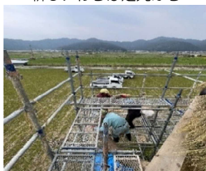
これがマンモス目線