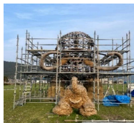
新しいわらは足元から

※難航していたわら貼り作業も3月最終週～4月1週目には有志の会と地元皆さんの応援によって進みフサフサになりました。