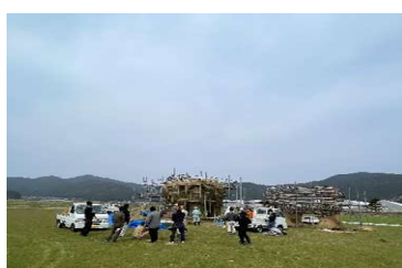
壮年会の皆さんも応援に！！