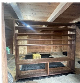
式台に載せる下駄箱作り