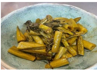
しっかりアク抜いてから油炒め