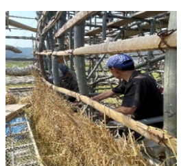
わらとばを麻紐で竹に結びます