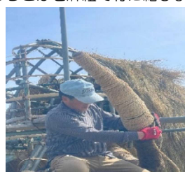
牙の荒縄巻きはハードな作業