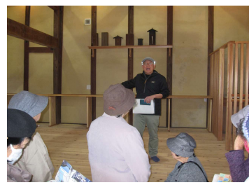
津島町岩松の町並み散策

また、津島町の町並み散策や宇和島城周辺の見学では、地域の歴史や文化に直接触れながら和やかな雰囲気の中で交流も深まりました。今後も地域の魅力を再発見できる学習会を企画してまいりますので、ぜひご参加ください。(^^)。