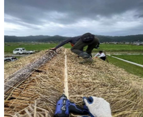
マンモスに合わせて藁屋根に