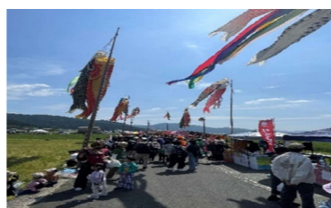
次回は出店してみようかな・・・