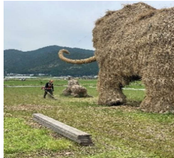
わら交換後の草刈り作業

※残念ながら縮小開催となつたれんげまつりですが、天候にも恵まれ、会場はいつもと変わらないくらいの大賑わいでした。