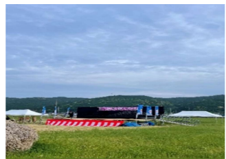
今年の特設ステージ！！