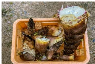
これがタケノコ地獄の始まり

※草刈りご依頼のお客様からタケノコをいただき、もしかして我が家裏手の竹やぶにいくとそこには大量のタケノコが！！