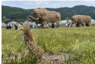
取り残され佇む藁の束