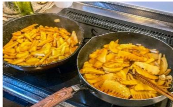
タケノコ炒め（台湾メンマ風に）