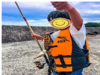
良い思い出になったはず

中山ゆたか石城録をご覧頂きありがとうございます。我が家のゴールデンウィークは家族総出での続引越えであったという間に時間が過ぎ去りました。おかげさまで住まい部分の引越えはおおた進み、今は『石城のなんでも屋』倉庫兼事務所を整備中です。そして、エアコンクリーニング、草刈り等のご依頼を多くいただいておりますが、可能な限りご希望の日程で作業できるように努力いたしますので、今後とも宜しくお願いいたします。