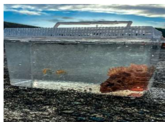
釣果はカサゴと豆アジ数匹