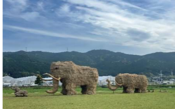
雨上がりのしっとりマンモス