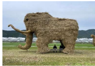
期間限定？マンモスベンチ