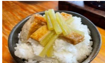
番外）フキと天ぷらの煮物