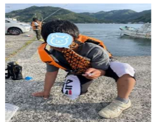
針外しも慣れたもの