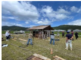
岩木ほのほの広場の小屋作り