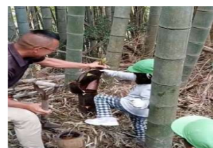
保育園児にも応援要請を