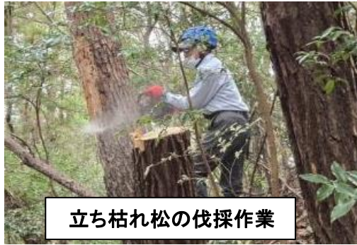
立ち枯れ松の伐採作業