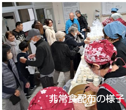
非常食配布の様子

避難後は、区長、自主防災、消防署の方から一言いただき、非常食の配布が行われました。以前、ご購入いただいた防災ボックスには、購入された方が防災グッズを入れにセンターに来ています。職員がいる平日はいつでもお持ちいただいて構いませんので、いざという時の備えを行いましょう。