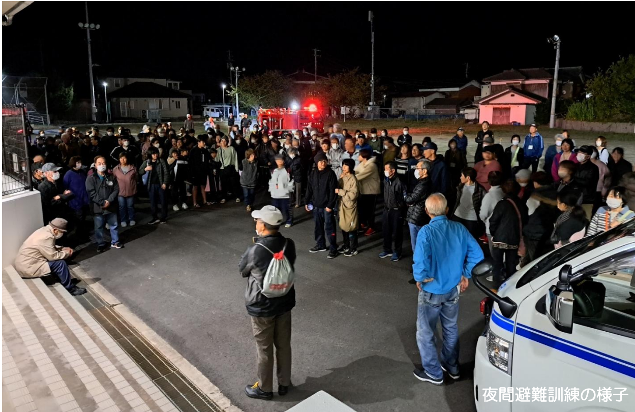
夜間避難訓練の様子

11月5日、周木区夜間避難訓練が行われました。訓練に参加をした方は約220人と住民の半数の方が参加され、防災への意識の高さを感じることができました。