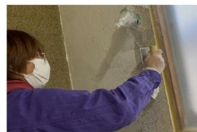
壁塗り 変わっていくの楽しい! でも意外と疲れる…

十二月の作業: ・屋根・外壁塗装 ・脱衣所の壁塗り ・消防設備の設置 外壁の色がだいぶ変わり、派手になってきました(笑)。何色か気になる方は、ぜひ一度見てみてください! そんな中、私は漆喰壁塗りに挑戦! 動画を見て勉強し、いざ実践! うまく塗れるはずもなく、何度も力を込めて塗っていると、翌日見事に筋肉痛になりました(これを書いている現在も)。一人作業では無理ということに気づいたので、開業後にみんなで壁塗り体験会でもしようかなと考えている今頃です。 建物もオーナーも未完ですが、(とりあえず)一月に開業予定です。あと少し! 準備がんばります!