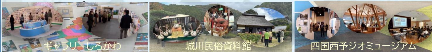
ギャラリーしろかわ 城川民俗資料館 四国西予ジオミュージアム

11月20日(木)に、第5回女性セミナーを実施しました。今回は「奥伊予3施設観光研修」。城川町にある四国西予ジオミュージアム、城川民俗資料館、ギャラリーしろかわを訪れ、歴史や文化を学ぶ大人遠足に行きました。 ジオミュージアムでは、スライドや展示エリアなどで、周木のジオを含めたお話をいただきました。四国西予ジオパークは4つのエリアで構成されています。展示室は常時各エリアを絨毯で色分けし、それぞれの魅力が楽しめる仕組みになっていたり、ジオクエストに挑戦できたりとあつという間に時間がたっていました。 その後は食酢坊宝で昼食。全メニューとてもボリュームで大満足でした。 午後は、城川民俗資料館へ。文字の記録や民俗資料だけでなく、城川地区で発見された石器や人骨が展示されているエリアもあり、職員さんにお話をいただきました。愛媛県で昔の人骨が展示されているのは、城川含め2か所とのこと!! 貴重な時間となりました。 ギャラリーしろかわでは、かまぼこ板に込められた思いや展示についても案内をしていただきました。第30回の応募作品6331点が全て展示されており、素晴らしい作品の数々に感動。芸術の秋にふさわしい時間を過ごすことができました。 最後はきなほは屋しろかわでお買い物とティータイム♪楽しかったというお声もいただき一安心♡ ご参加いただいたみなさん、案内をいただいた各施設の職員のみなさん、楽しい時間をありがとうございました!!