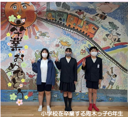
小学校を卒業する周木っ子6年生

令和7年度、周木では5人の子供たちが小・中・高校を卒業します。皆さんご卒業おめでとうございます。左の写真は今年小学校を卒業する3人です。学校が早く終わるとセンターに遊びに来てくれていました。いつもセンターに楽しそうな声を響かせてくれてありがとう。中学生になっても遊びに来てね。