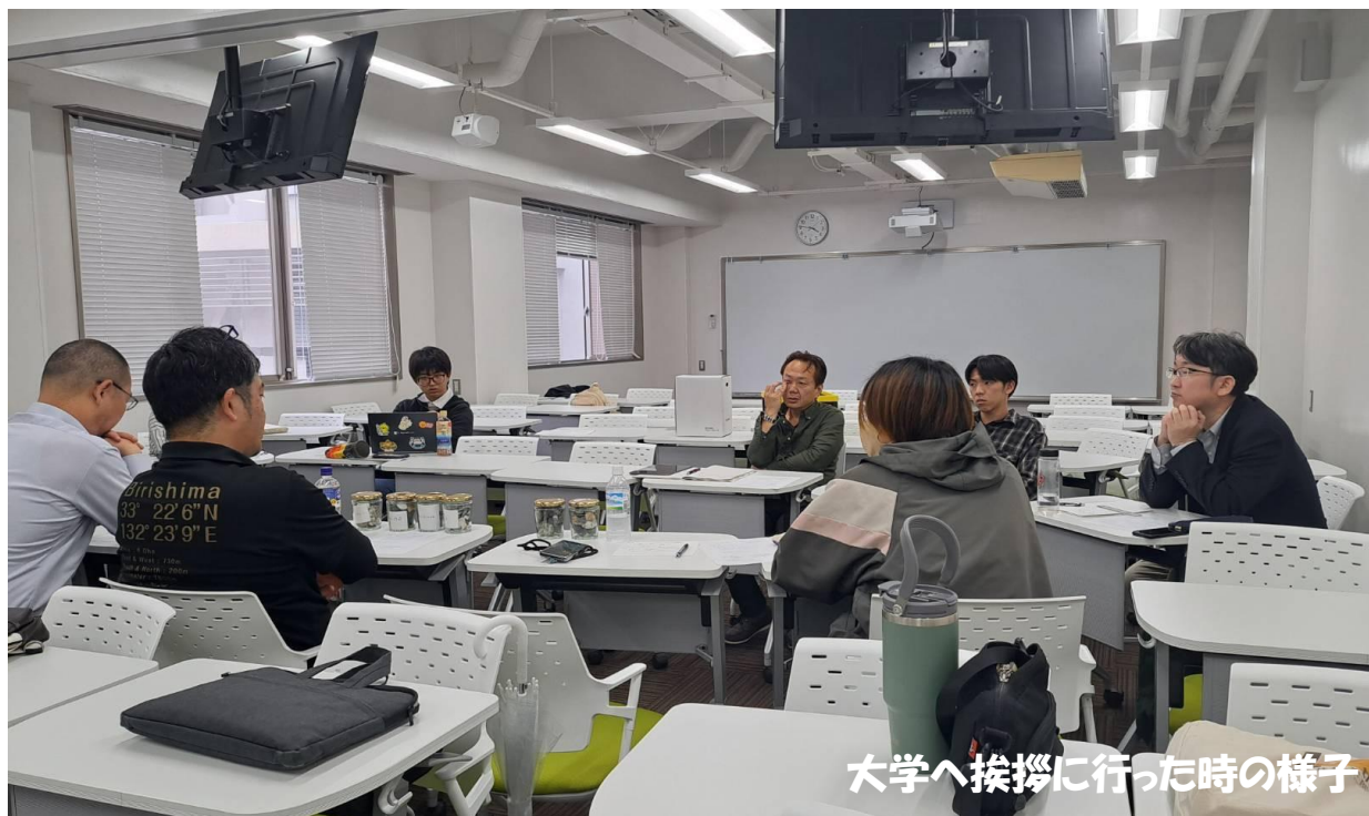
大学へ挨拶に行った時の様子

令和8年度に入りました。今年度も今までの活動を継続しつつ、地域づくり活動センターと協力しながら活動を行っていききたいと思っております。