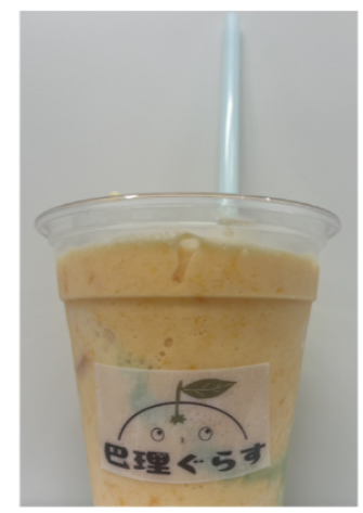
試作途中… ゼリー入れたり、ジュースと混ぜたり試行錯誤中