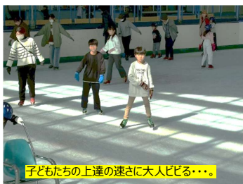
子どもたちの上達の速さに大人びる・・・