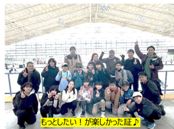
もっとしたい！が楽しかった証♪