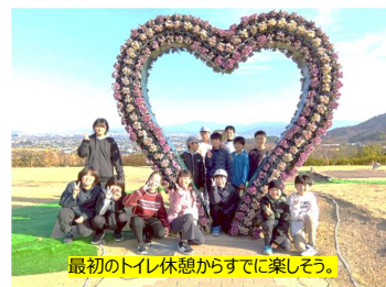
最初のトイレ休憩からすでに楽しそう。

田之筋緑の少年団活動もいよいよ佳境。今年の冬の活動は、県内では貴重となるアイススケート体験に挑戦しました！1月18日(日)、晴天のもと、5・6年生と役員あわせて22名が参加し、松山市のイオテツスポーツセンターへ向かいました。最初は慎重に滑っていた子どもたちも、慣れるにつれて「できた！」「もう一周！」「もう一周！」と笑顔があふれ、転んでもすぐ立ち上がる元気な姿が見られました。スケート後はローズハウスのランチバイキング、とべ動物園の見学など、盛りだくさんの一日。仲間と過ごす冬の楽しい体験となりました。詳しい様子や写真は、次号でご紹介します。