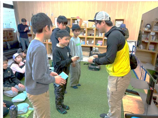
代表からの卒団記念品贈呈と感想発表。