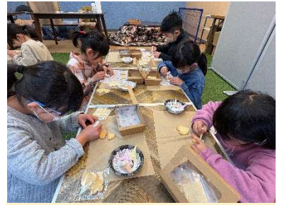
絞り袋を駆使した集中のひと時。