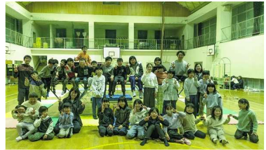
22年目、今年もにぎやかに締めくくり！

平成17年12月から続く田之筋トランポリン教室。今年度も年間10回開催し、田之筋小の児童を中心に、他校区や未就学児を含む36名が参加してくれました。2月26日には今年度最後の練習を実施し、子どもたちはこれまでの練習の成果を確かめるように、元気いっぱいに取り組みました。最後は集合写真を撮影し、1年間の活動を明るく締めくくりました。来年度も6月から実施予定です。来年度もよろしくお祈りします。