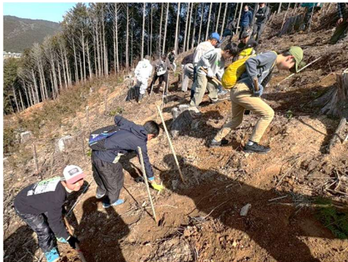
ぽかぽか陽気の中、一人ひとりが苗木を植樹