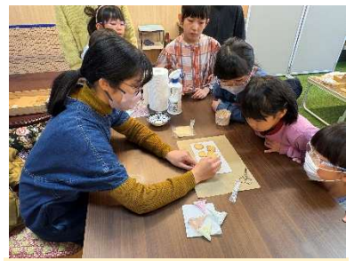
先生のお手本にみんな釘付け！

※たのまるショップ内のコミュニティスペース（文庫八八・産直市・ボルダリングジム・くつろぎスペース）は、オープン中どなたでも利用できますので、ぜひお気軽にご利用ください。