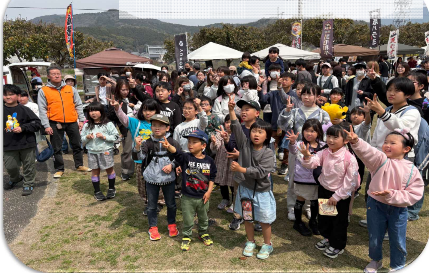
満開の桜の下、子どもから大人まで多くの笑顔が集い、にぎやかで心あたたまるイベントとなった桜まつり。春の訪れを感じながら、人と人とのつながりをあらためて感じるひとときでした