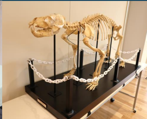
ツキノワグマ骨格標本