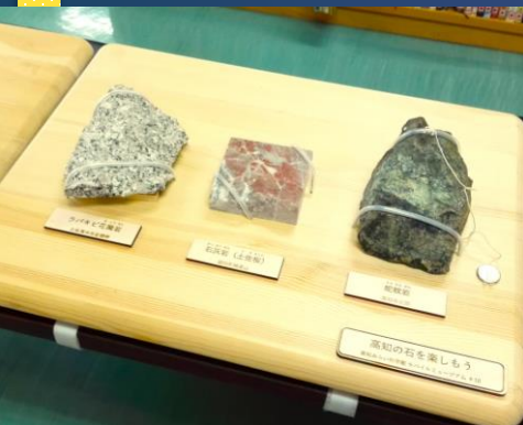
展示「高知の石を楽しもう」