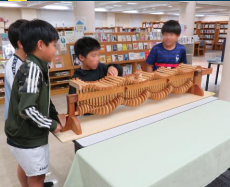
「からくりサーフィン」実験装置