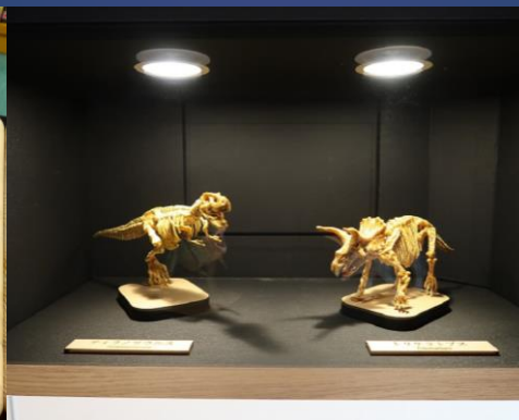
「恐竜ボックス」実験装置