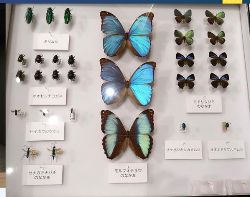
展示「きらめく虫のひみつ」

「高知みらい科学館」が所蔵する、豊かな自然が分かる展示物や、楽しい科学実験装置が、四国西予ジオミュージアムへやってくるよ！ ゴールデンウィークは四国西予ジオミュージアムに遊びに来てね！