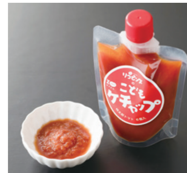
こどもケチャップ

標高およそ600mの高地で栽培した程よい甘みと酸味のある遊子川産完熟トマトで作ったトマトケチャップ。完熟トマトに自家製トマト酢を加えて、じっくり煮込んで作り上げています。無添加なので、大人だけでなく、子どもも安心して食べられます。