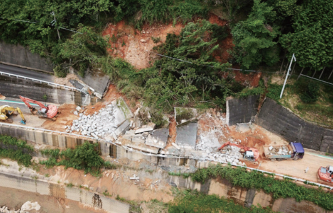
平成 30 年 7 月豪雨で発生した土砂崩れ