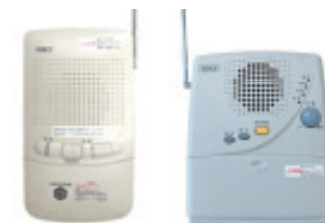
交換が必要な宇和地区のアナログ式戸別受信機

6月1日（火）から市内すべての防災行政無線放送がデジタル放送に切り替わります。アナログ式戸別受信機では、6月以降の防災行政無線放送を聞くことができません。