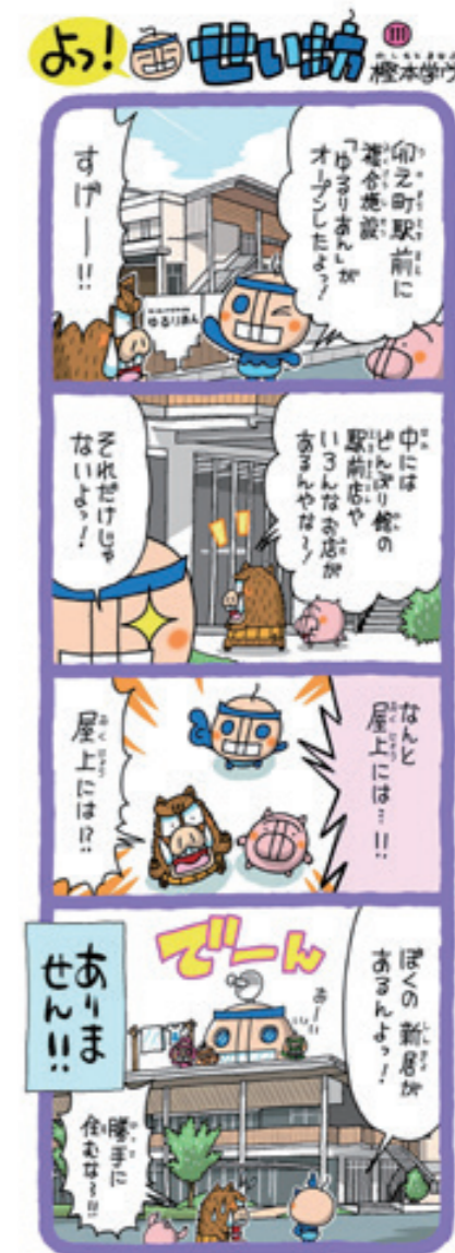
新しく卯之町駅前にてきた施設「ゆるりあん」ご飯を食べられて、新鮮な野菜も買えるんよ。本当に住みたいくらい。みんなも行ってみてね〜