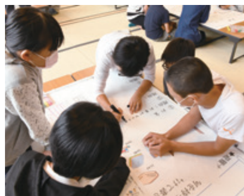
13のメニューから選択できる選択学習