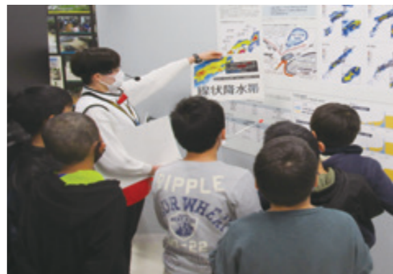
必須学習の災害伝承室の見学

平成30年7月豪雨災害の教訓などを防災減災学習に生かすため、市内小・中学校向けの「災害から学ぶ」パッケージ学習事業をスタートします。 パッケージ学習の概要 パッケージ学習では必須学習と選択学習を自由に組み合わせることが出来ます。 必須学習 乙亥会館の災害伝承展示室を活用した学習