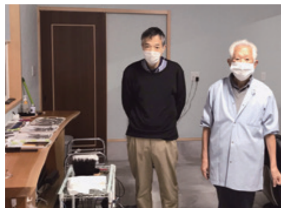
復興補助金を活用して再建した店舗