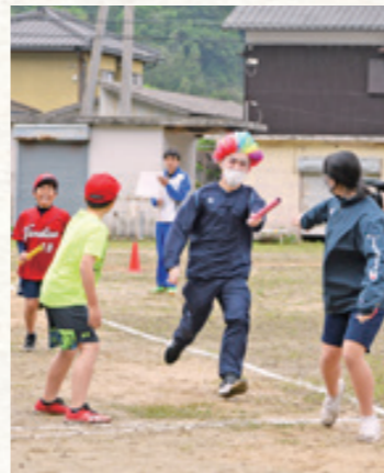
大人、子ども関係なし。大会一番の目玉種目「本気魂リレー」。子どもの「元気」と大人の「意地」がぶつかり合う