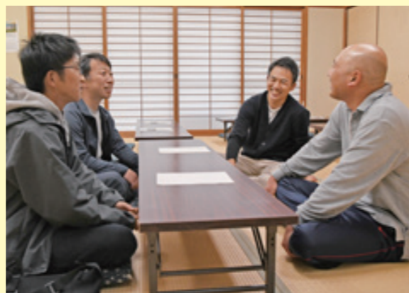
地域に一番近い場所で働く地域づくり活動センター職員(写真右2)

各センターの運営には、地域が雇用する「地域任用職員」も参画。地域の福祉や子育て、防災、日常的な困りごとまで、さまざまな議論が重ねられる場に。住民と、チャレンジを恐れない職員が連携することで、地域の未来を想像しながら理想とする地域づくりが各地で進んでいます。