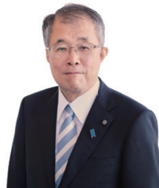
西予市長 管家 一夫

魅力ある「西予ふるさとづくり」の新たな挑戦とさらなる飛躍に向けて、やる気と可能性に満ち溢れた新しい力を必要としています。西予の未来を、共に創っていきましょう。