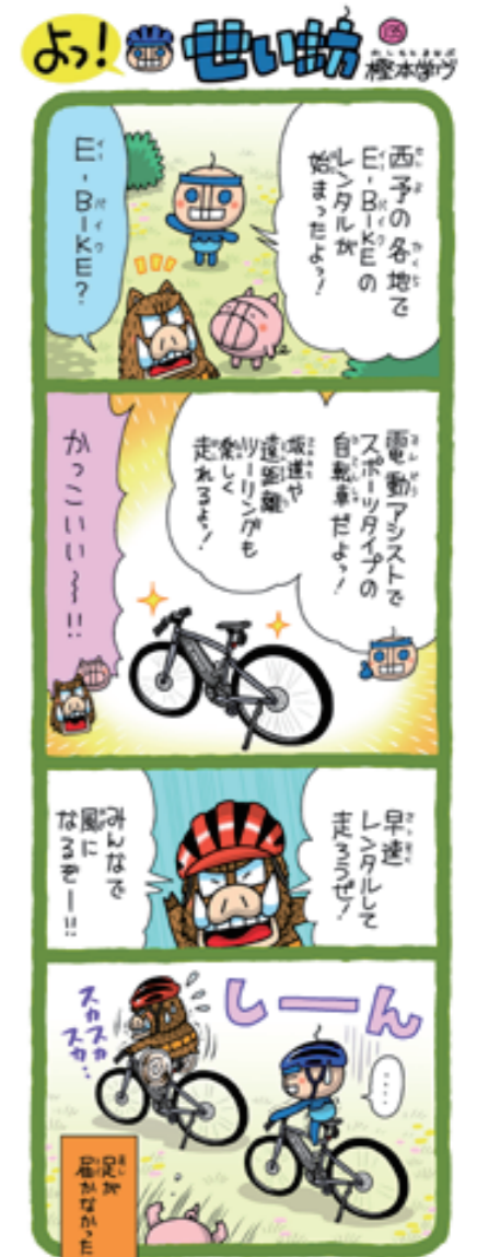
E-BIKEで西予市内をサイクリング! 風を切って走るの、とっても気持ちいいよ!! 僕は足が届かないけど...