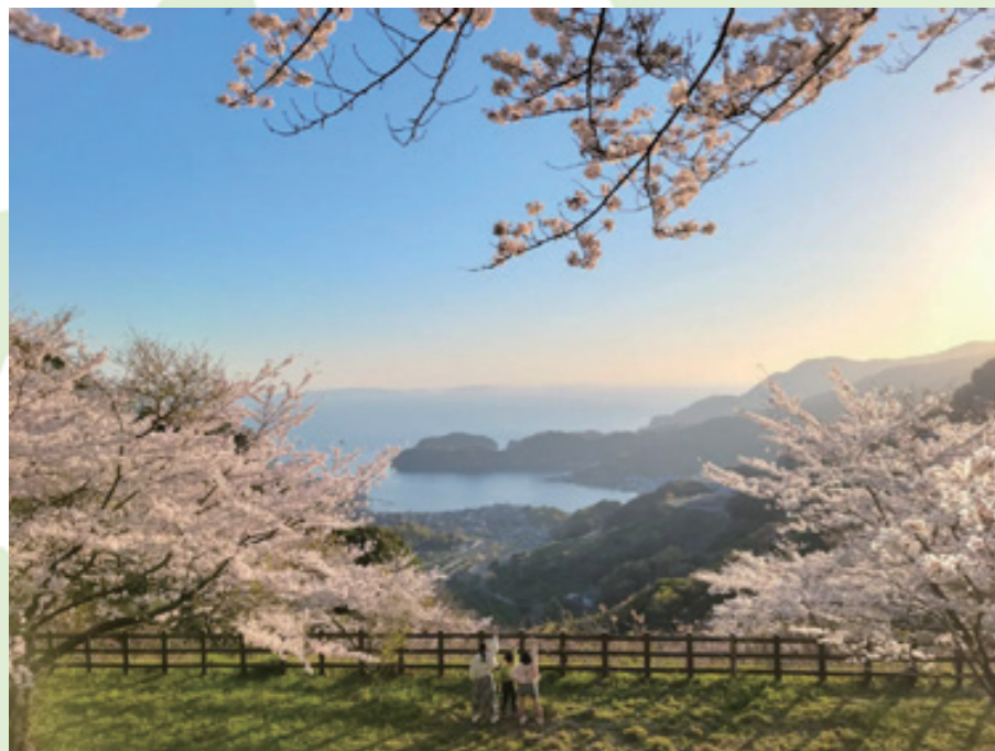
📅 4月22日 📍 野福峠