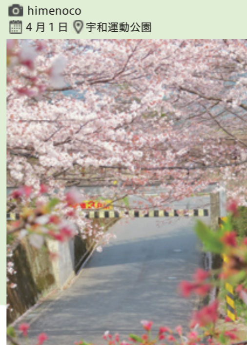
📅 4月1日 📍 宇和運動公園