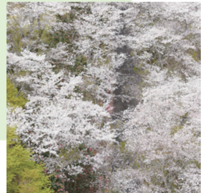
📅 3月30日 📍 野村町愛宕山