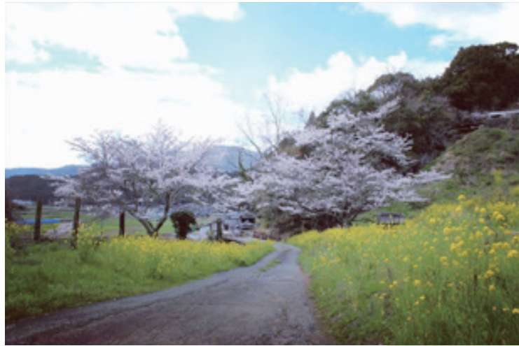
📷 k1118kairu4 📅 3月24日 📍 関地池