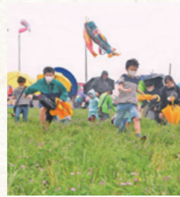
雨の中でも元気いっぱい。れんげ田を使った宝さがしは子どもたちに大人気