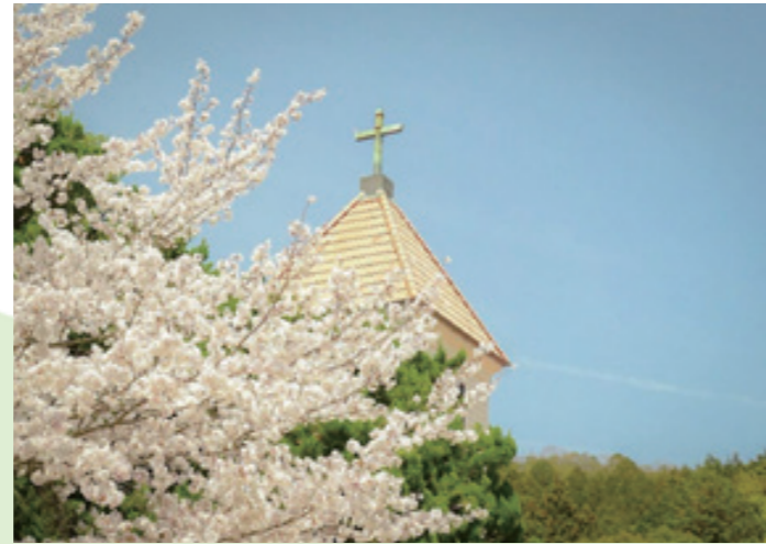
📷 yamabo_seiyo 📅 3月29日 📍 卯之町の町並み