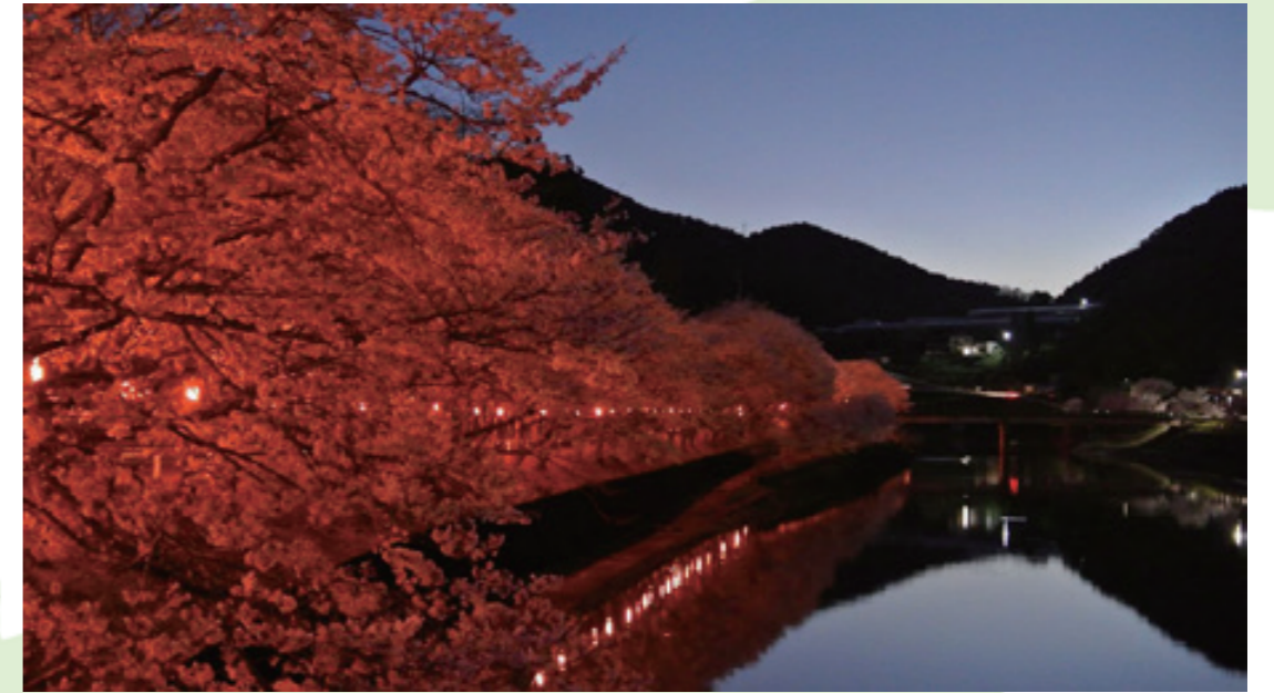
📅 3月28日 📍 宇和町明間