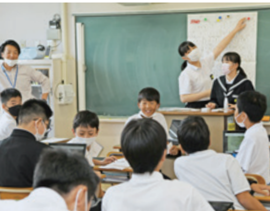
「この漢字は小学生には難しいかな」。試行錯誤して、より良いものに

す。今年度は、5つのチームに分かれました。その中の1つボードゲーム&スタンプリーパーチームは昨年、野村をテーマにしたボードゲームを制作。すぐろくのような形式で、野村の特産品や名所、災害、防災などのことを学ぶことができます。ボードゲームにしたのは、小学生以下の子どもたちにも遊びながら、野村のことや災害のことを知ってほしいという思いから。今年は、語り部とのまち歩き