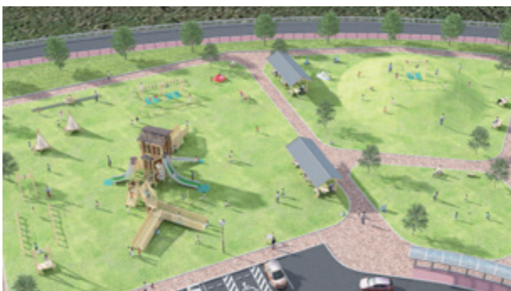
西予ちぬやパークの完成イメージ

道の駅どんぶり館横に建設が進んでいる市児童公園。名称は、企業名や商品名を冠した愛称を付与できるネーミングライツを取得した企業が付けることができます。 ネーミングライツを取得する企業を募集し、審査した結果「(株)味のちぬや」に決定。5月15日(月)に契約締結式と名称の発表がありました。