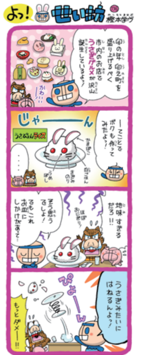
僕のうさぎまんライスはどうか? おもしろいよ〜。市内のいろいろなお店で「うさぎクレープ」を提供しているから、みんなも食べてみてよ!!