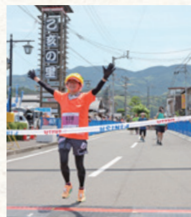
激しいアップダウンをのり越えて笑顔でゴール

アップダウンの激しい野村ダム周辺を巡るコースを駆け抜けたランナーは「きつかったけど、温かいおもてなしのおかげでゴールできた。来年もまた参加したい」と笑顔で話します。