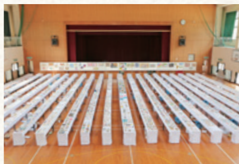
会場いっぱい並ぶ6000点超の「かまぼこ板の絵」

ぼこ板のキャンバスに描かれた作品を一点一点審査しました。大賞作品などは「広報せいよ」でも紹介します。第28回展は7月15日(土)から令和6年1月14日(日)まで開催する予定です。