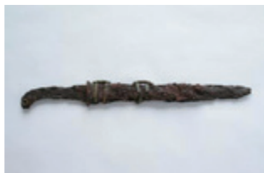
明石古墳から出土した蕨手刀

西日本では奈良県、島根県、山口県、徳島県、愛媛県、福岡県、熊本県、鹿児島県で8点の蕨手刀が見つかっています。蕨手刀が出土した遺跡は、周囲に同じ時期の遺跡が見られない外れの地域にあるといった法則性も指摘されています。こうしたことから西日本で蕨手刀が出土する遺跡は、新興勢力と関連しているといわれています。