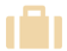
地域外の人材雇用

地域内の NPO 法人などの団体に業務を委託する方法です。複数人で請け負っている場合は、個人のスキルなどに応じて担当者を変えながら業務を推進できます。