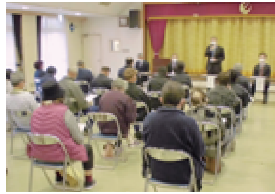
説明会の様子（惣川地区）