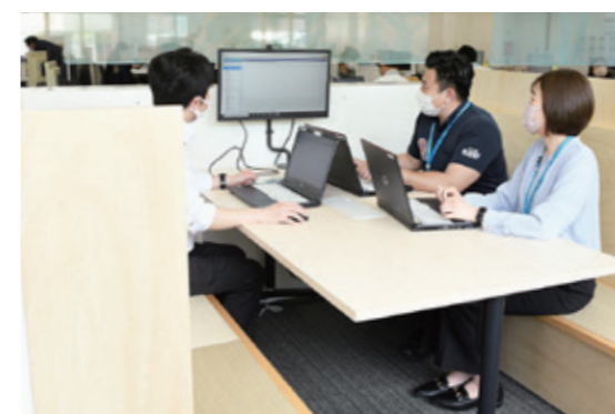
4階執務室(写真上)、協議スペース(写真下)