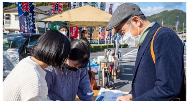
▲【報告資料より転載】当日の販売の様子（ワークショップ事務局員もいただきました。どれもおいしかったです♪）