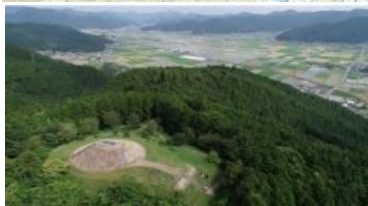
笠置峠古墳（県指定）